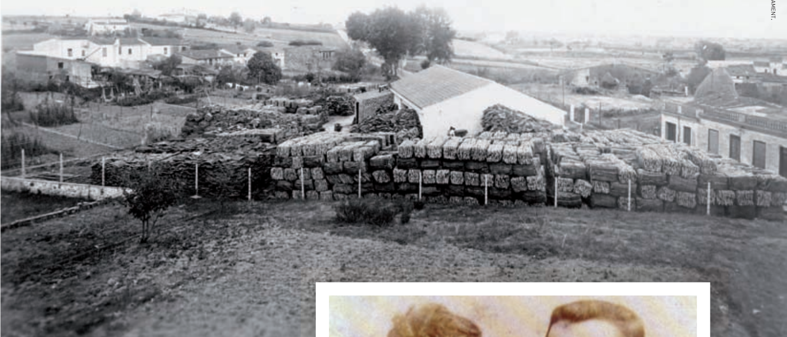
>> Vista general de la fàbrica Oller en el carrer de Marina, de Cassà de la Selva, en els anys trenta del segle xx.

Per sort, Francisco Oller coneixia un ofici, el de taper, i el 1885 emigrà, primer a la Llombardia, després a Tolosa, i finalment a la Xampanya, on es trobà amb altres gironins. No es tornen a tenir notícies de Francisco Oller fins al 1891, ara ja a Épernay, on era l'encarregat de vendes de la sucursal del taper de Llagostera Jaume Coris.