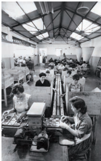
>> Interior de la fàbrica Oller en els anys quaranta del segle xx.