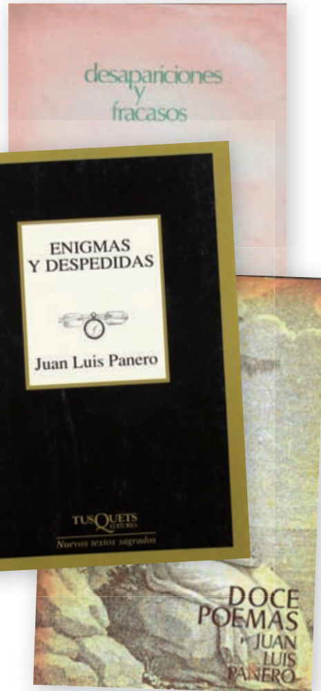
>> Tres llibres de Juan Luis Panero.

La seva vida es converteix en literatura i cada poema condensa en un instant tot el sentit –o la manca de sentit– de la seva existència