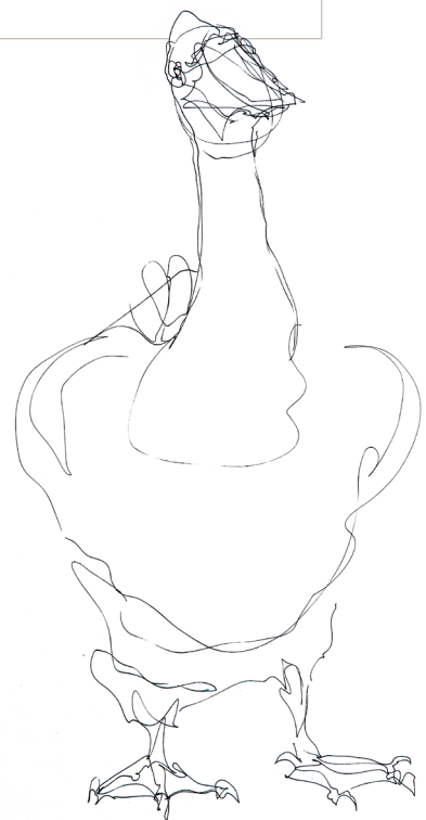
Oques (2013), 60 x 42 cm, retolador sobre paper.