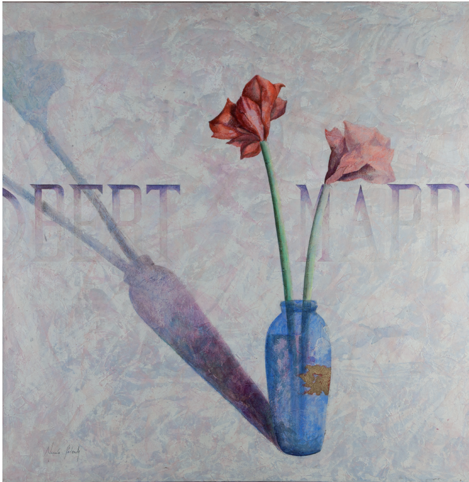
Bien aimé (1991), 100 x 100 cm, acrílic sobre tela.