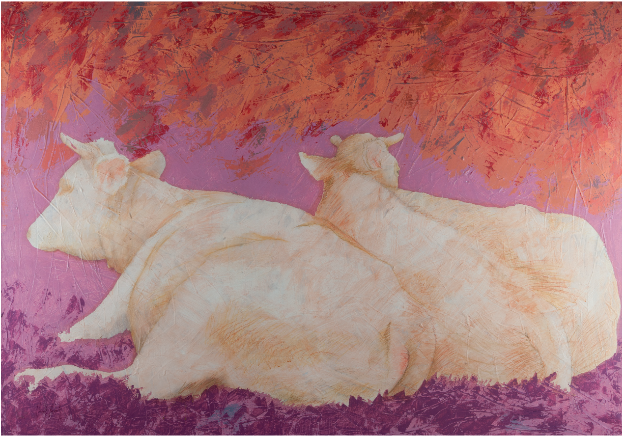
Vaques a la tardor (1993), 162 x 114 cm, acrílic sobre tela.

bon començament. Va cursar l'especialitat de restauració, més per imposició familiar que per interès, ja que la seva vocació ha estat sempre la pintura.