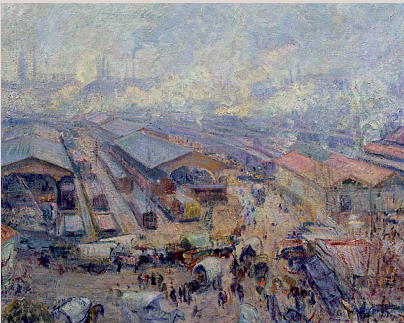
>> Joan Colom Agustí. Estació de França. 1911. Oli sobre tela. 60,3 x 73,5 cm. Museu Nacional d'Art de Catalunya.

Jaume Mercadé, de l'escola noucentista, va aconseguir un premi amb el quadre Zeppelin , de 1930, amb el dirigible i dues siluetes d'avions volant sobre els teulats de Barcelona. Del mateix autor, i ple d'interès, és el Paisatge suburbial , un conjunt imponent i solitari de fàbriques, xemeneies i conduccions elèctriques. A Ramon Capmany també l'atrau el tema, generalment marginat, dels terrats, i pinta Terrats de Sants , obra en què sobresurten les abundants xemeneies de tantes indústries que ocupaven aquell districte de Barcelona. I com a brillant, l'obra Paral·lel (1930), d'Emili Bosch Roger, un dels retrats més vius d'aquesta avinguda barcelonina: autobús de dos pisos, tramvia, cotxes, carros, terrasses de bars, abundància de persones i les xemeneies de la tèrmica.