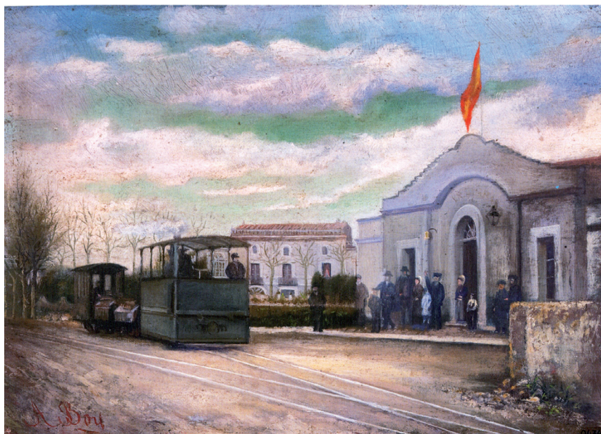
>> Agustí Boy. L'estació de la Bisbal. 1888.

El Municipal de Tossa, tan bellament instal·lat, no conté ni un quadre per poder-lo anotar en el sector d'interès que em guiava.