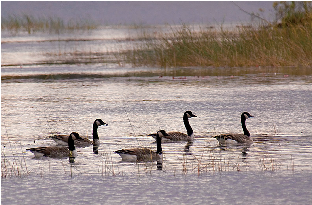
>> Grup d'oques del Canadà ( Branta canadensis ).