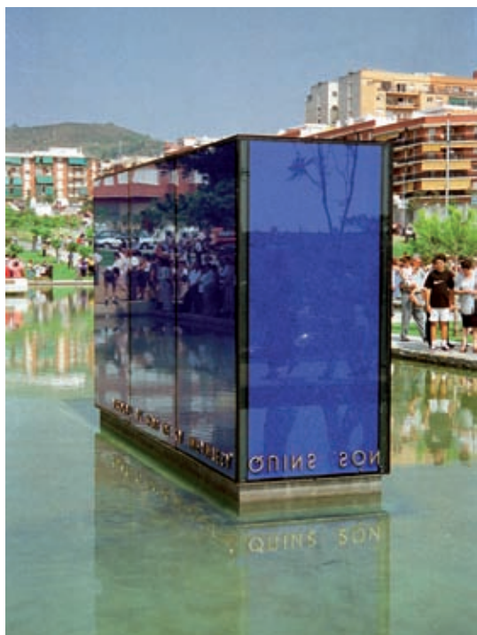
Un eco blau (1997). Caixa de vidre de 442 x 120 x 230 cm, amb pigment blau i poema de Víctor Sunyol amb lletres de bronze invertides. Escultura al parc Torrent d'en Ballester, a Viladecans.