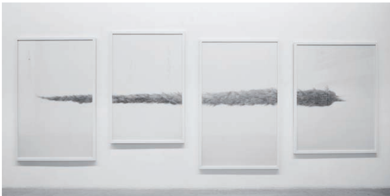
Xiprer (2008-2009). Llapis sobre paper. Peces que, un cop muntades, fan 229 x 548 cm.

litar al públic la comprensió dels processos de creació.