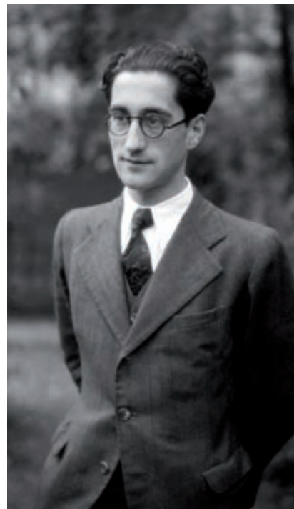
>> Joan Teixidor de jove.

Malgrat l'extensió restringida de la seva obra, Teixidor és un poeta de primera magnitud que senzillament no ha tingut prou reconeixement