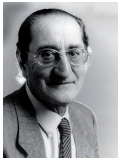
>> A dalt, Joan Teixidor. A l'esquerra, Joan Teixidor, Josep Pla i Néstor Lujan, quan Teixidor era l'editor de Pla.