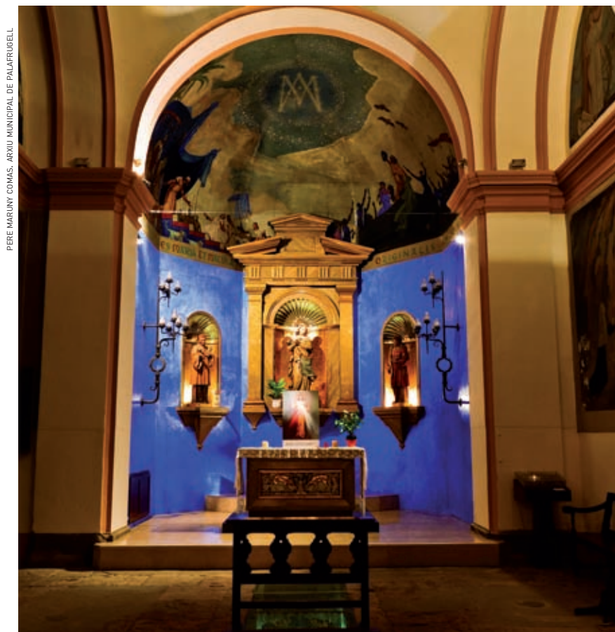
PERE MARINY COMAS. ARXIU MUNICIPAL DE PALAFRUGELL