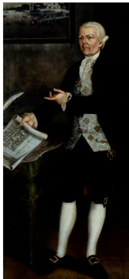
PERE MARINY COMAS. ARXIU MUNICIPAL DE PALAFRUGELL

Els èxits i miracles d'uns i altres s'havien escampat, i les eficaces xarxes de família i veïnatge havien afavorit que proveysin l'aventura americana