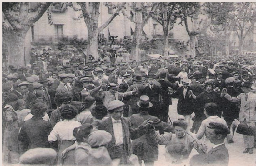
>> Postal d'una ballada de sardanes a la Rambla de Figueres (c. 1913).

Si l'estada de Jacob a Figueres va ser en primavera, una altra que va fer a Madrid va ser a l'hivern del 1926, amb temps fred i plujós. Potser per això, mentre que els seus adjectius per descriure Espanya són els de «seca, austera, amb un cel gris», a Figueres «tot era color i llum». Ho diu també el poema: «L'encaix del groc i el roig prou que combina / oh tenora, amb les teves gammes al·liàcies».