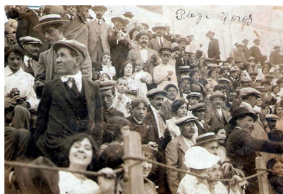
>> Fotografia del públic assistent a una cursa de braus a Figueres, a començament del segle passat.

fer pensar en un altre motiu almenys per al primer d'aquests desplaçaments. Durant les Fires de la Santa Creu, de la primera setmana de maig, s'havia organitzat una exposició d'olis i pastels de Ramon Pichot al saló del cine Edison. Podríem pensar que el nom de Pichot, que tres anys abans havia convidat Picasso a passar una temporada a Cadaqués, havia d'interessar al pintor malagueny, així com la temàtica de les obres, inspirades en Cadaqués i temes com la Corrida de toros . Però la relació entre