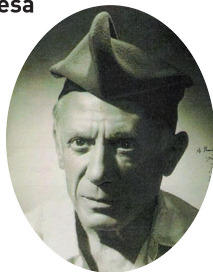
>> Picasso, retratat pel fotògraf Raymond Fabre, a Perpinyà, el 1955. Es va fer anar a comprar la barretina a Figueres.

Picasso havia visitat Figueres l'estiu de 1910, encara que de passada, en les seves anades i vingudes de Cadaqués, on va romandre quasi dos mesos amb la seva companya Fernande Olivier