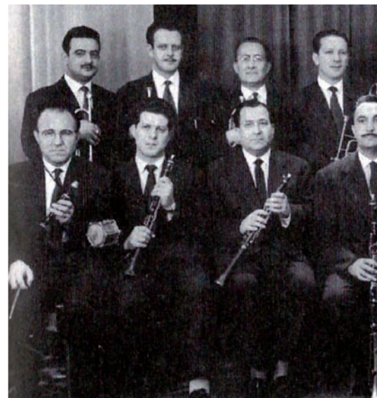
>> La Principal de la Bisbal, l'any 1956.