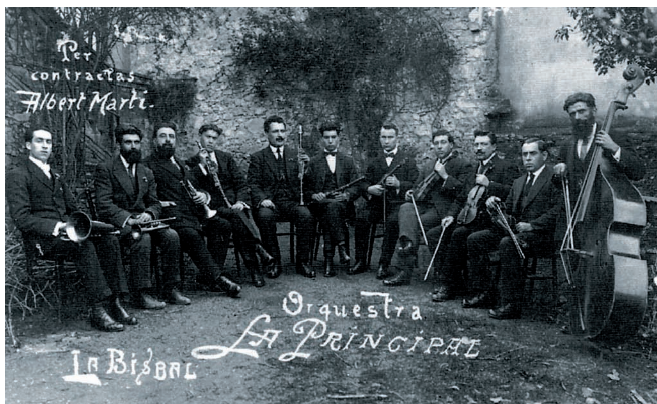
>> La Principal de la Bisbal al voltant de 1920.