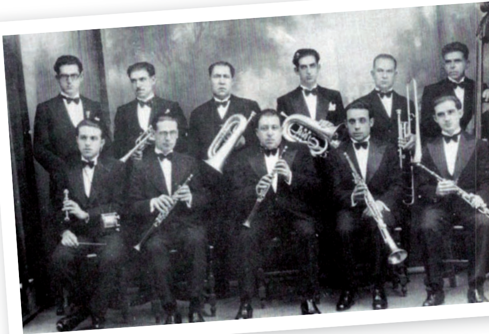
>> La Principal, l'any 1932, quan guanyà el premi d'honor a Sant Feliu de Guíxols.