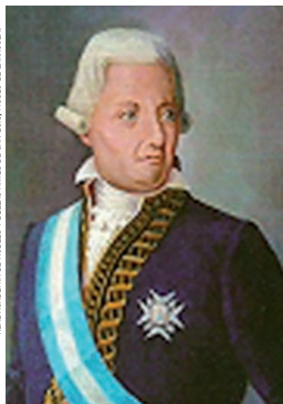
REAL ACADEMIA DE NOBLES Y BELLAS ARTES DE SAN LUIS, MUSEO DE ZARAGOZA