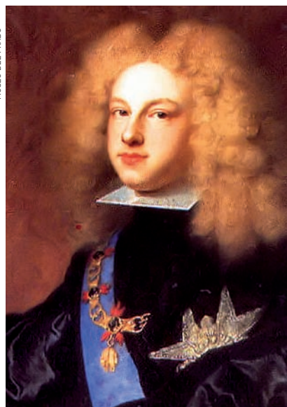
MUSEO DEL PRADO