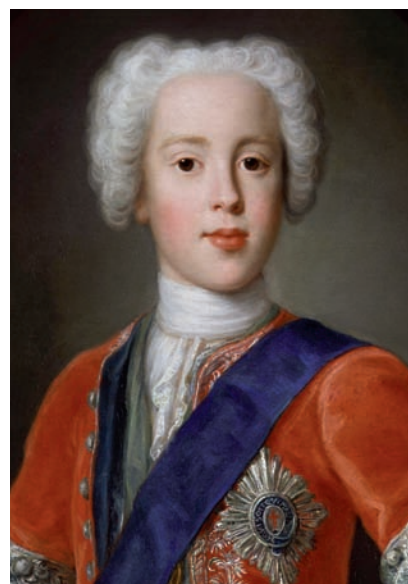
ANTONIO DAVID, NATIONAL PORTRAIT GALLERY, LONDON

>> Batalla de Culloden (1746) entre els jacobites sota les ordres de Carles Estuard i les forces britàniques comandades pel duc de Cumberland.