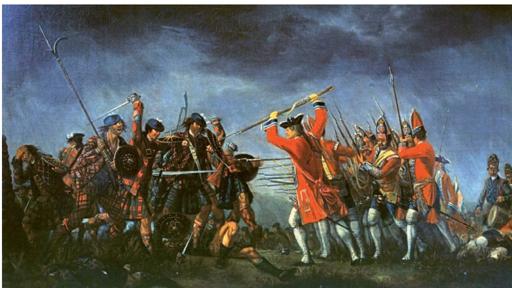
DAVID MORIER, NATIONAL PORTRAIT GALLERY, LONDON