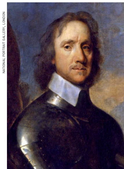
NATIONAL PORTRAIT GALLERY, LONDON