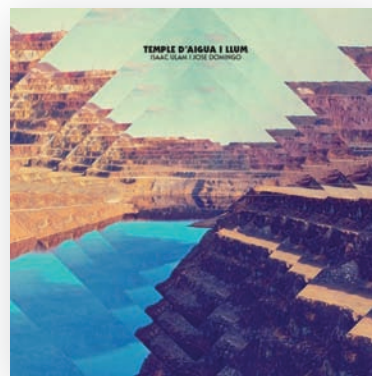
ULAM, Isaac i DOMINGO, Jose Temple d'aigua i llum Bankrobber

contracorrent. Ulam i Domingo pertanyen a una generació que ha crescut amb totes les variables possibles del rock i altres influències globalitzadores, però que rarament ha estat exposada al folklore autòcton, marginat fins fa poc per una modernitat mal entesa. Això ha canviat: com el mur de Berlín, han caigut les fronteres estilístiques, i molts grups actuals reivindiquen sense complexos les seves arrels més profundes, a través d'instruments, ritmes i melodies ancestrals, més o menys posats al dia. En aquest context, Temple d'aigua i llum fa un pas més endavant: Ulam i Domingo han compost cançons cent per cent noves, però elaborades amb ingredients que han anat a buscar a la jota, l'havanera, les cançons