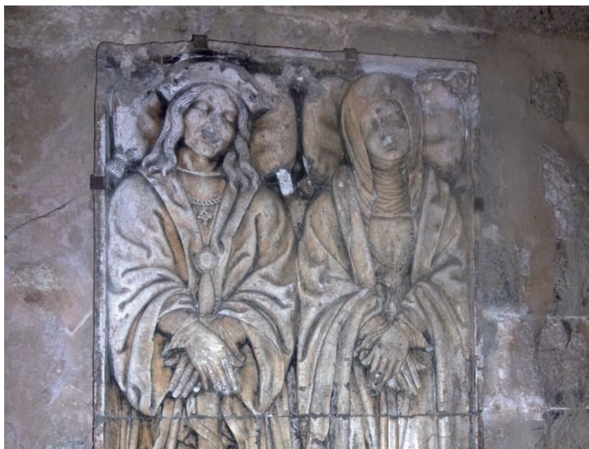
>> Lauda sepulcral de Ferran de Joara i Tímbor de Cabrera.