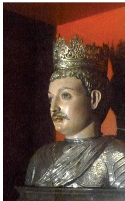
>> Bust reliquiari de sant Iscle.

la durant el mandat del primer (1461-1507), que també va ser president de la Generalitat entre 1470 i 1473.