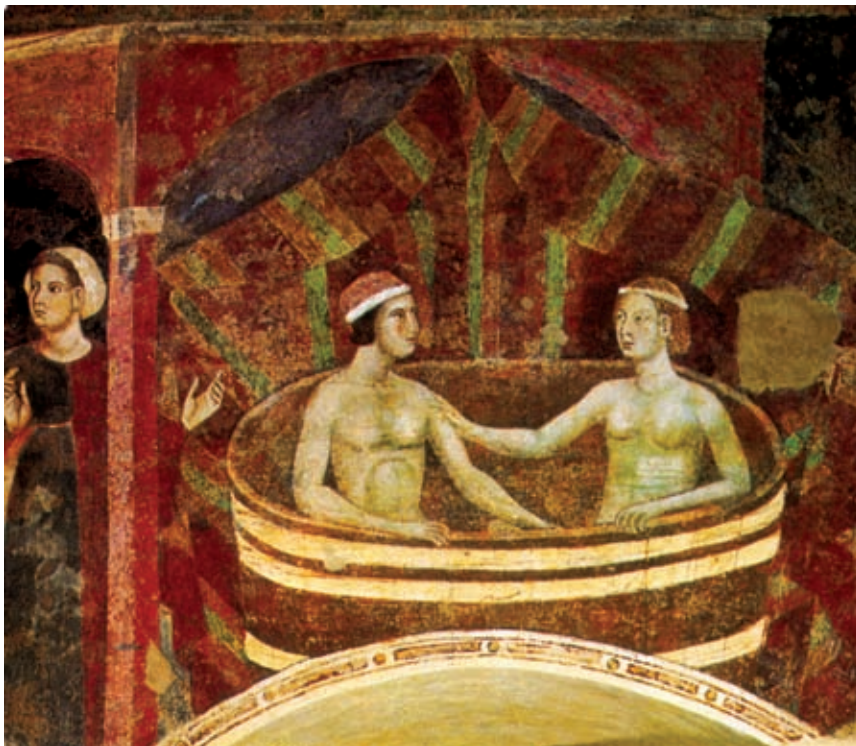
>> Escena nupcial de Niccolò di Segna.

socialment acceptat, per exterioritzar l'agressivitat i la sexualitat. Amb els acudits, sobretot els «verds», expressem temes que habitualment reprimim. Però la carn vol carn, deia Ausiàs March, i això no es pot contradir. Calidoscopi de clixés i creences que ajuden, en definitiva, a fer un pas més cap a la comprensió de la laberíntica i contradictòria condició humana, que no només viu de metafísics i teòlegs sinó d'instints i passions. Una natura catalana, en aquest cas: els homes i les dones catalans tenim una psicologia sexual pròpia i intransferible. Ras i curt: estimem i cardem en un català gens eixut. I no volem interferències.