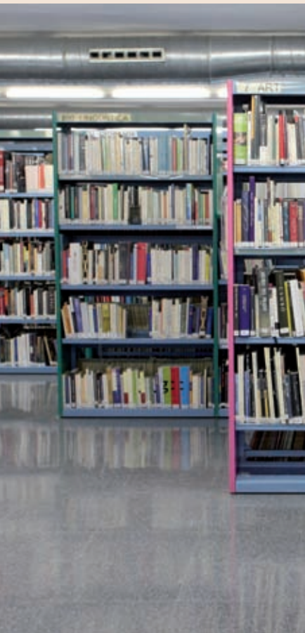
>> Biblioteca de Banyoles.