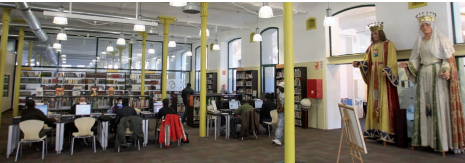
>> Biblioteca Iu Bohigas, de Salt.

per a la vida quotidiana (transport, salut, treball, ...) ja és a la biblioteca.