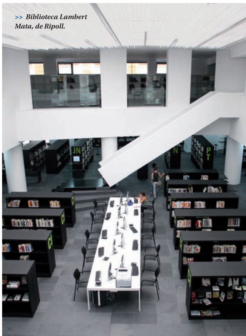
>> Biblioteca Lambert Mata, de Ripoll.

gües. Amb tot, es manté la preeminència del llibre i l'hegemonia del castellà i el català.