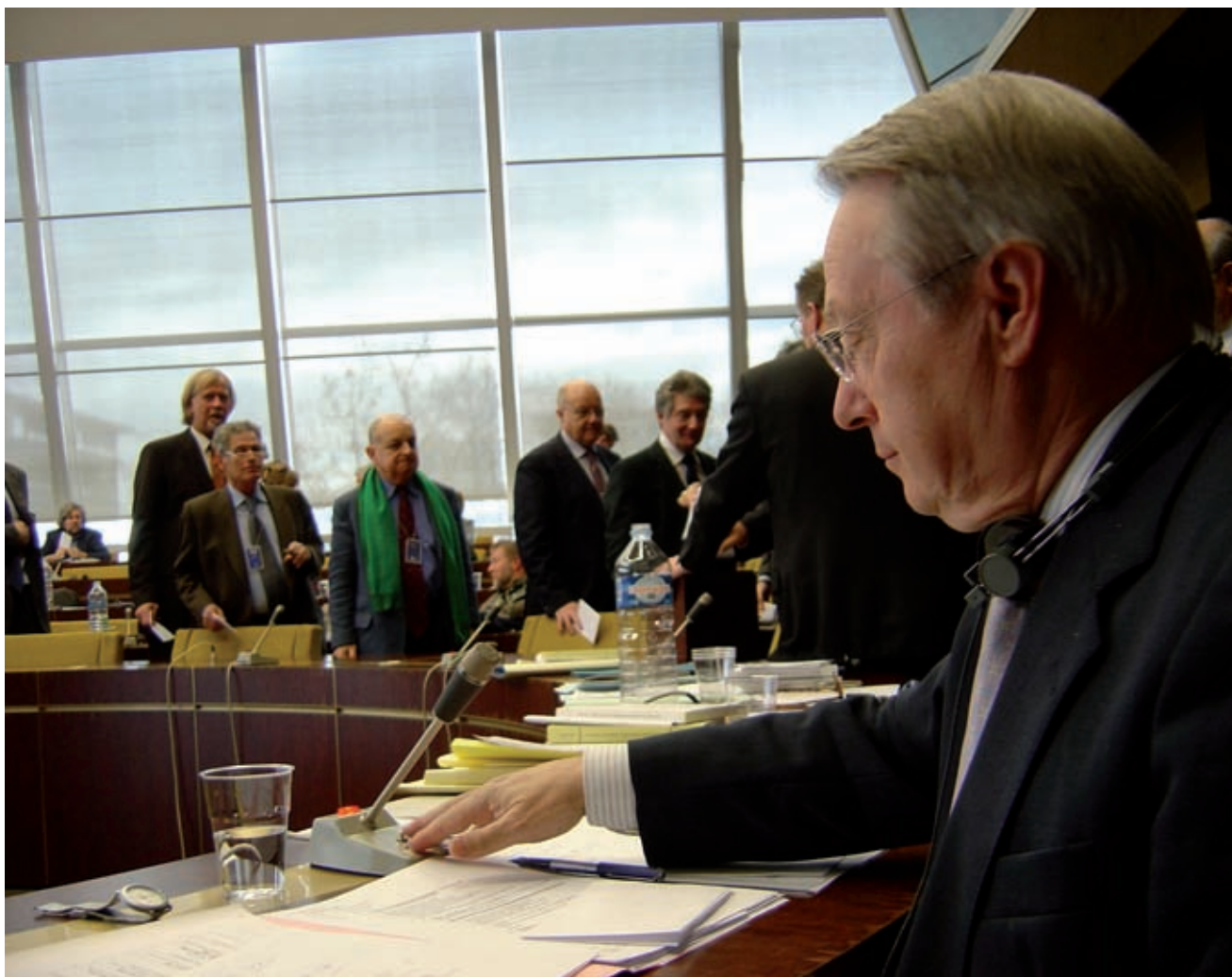
>> Lluís Maria de Puig. Visita al Consell d'Europa-Estrasburg. Sessió del gener del 2005.

ropa i la de l'Assemblea Parlamentària del Consell d'Europa. Després el van fer president honorari de l'Assemblea Parlamentària del Consell d'Europa.