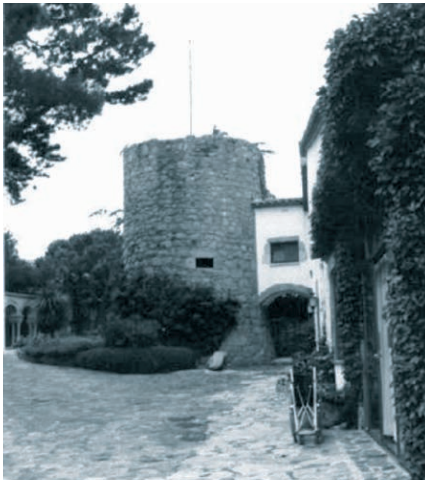
>> Mas del Vent, 1962. Al fons es veu el claustre.