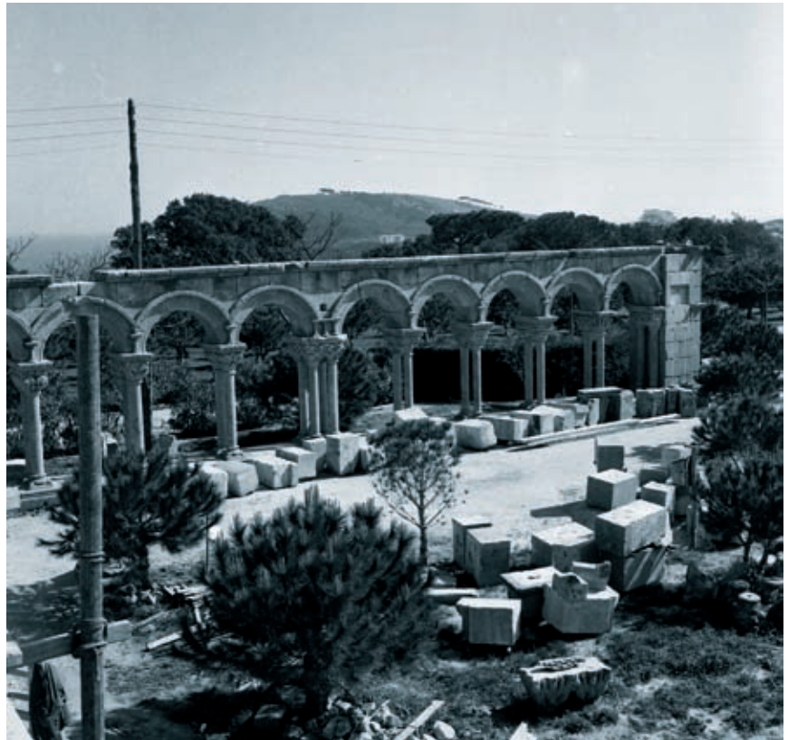
>> Fotografia de les obres de reconstrucció del Mas del Vent conservada a l'Arxiu Municipal de Palamós.

Als inicis, davant del monument, com si es tractés d'un museu, s'hi emplaçà un rètol: Claustro románico de Segovia. Siglo XII . Al cap d'uns anys, el cartell va desaparèixer.