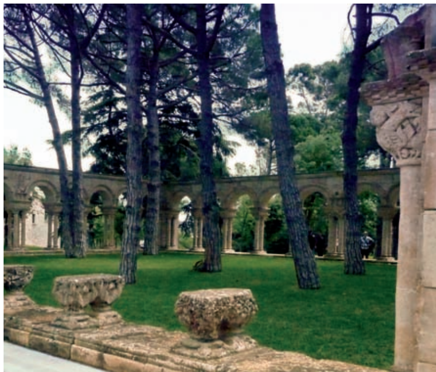
>> Una perspectiva actual del claustre.