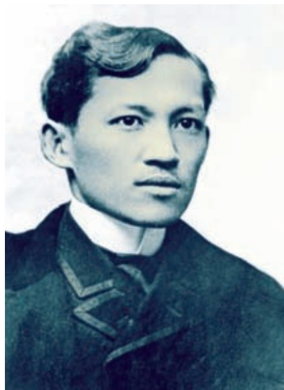
>> José Protasio Mercado y Alonso Realonda, més conegut com José Rizal (Calambá, 1861 - Manila, 1896).

En la seva primera visita a la península, José Rizal fa una anotació el 16 de juny de 1882 en el seu diari de viatge en la qual diu que l'impressionen Figueres i Girona, que recorda com a ciutat dels setges