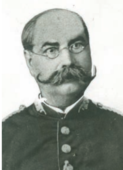
>> Ramon Botet (Palamós, 1828 - Barcelona, 1898).

Al llarg del temps, les nostres comarques han donat grans noms a la societat que han fet contribucions importants, en les més diverses disciplines, però si hi ha un àmbit en el qual tradicionalment els gironins mai no hem destacat gaire és el camp militar.