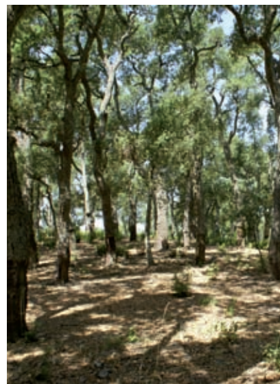
>> Alzinar de les Estunes (Pla de l'Estany). A sota, sureda de les Gavarres.

aprofitaments forestals permetrà reduir biomassa i reduir els riscos d'incendi. Si no es fa així, és possible que el foc acabi enduent-se molts de boscos i després —a corre-cuita i a mal preu— calgui retirar-ne la fusta. Només cal tenir present que en els quatre anys amb més hectàrees cremades a les terres gironines —1973, 1978, 1986 i 1994— van cremar-se 60.788 ha, i aquells incendis van generar 903.529 m 3 de fusta que va ser retirada a un preu molt baix.