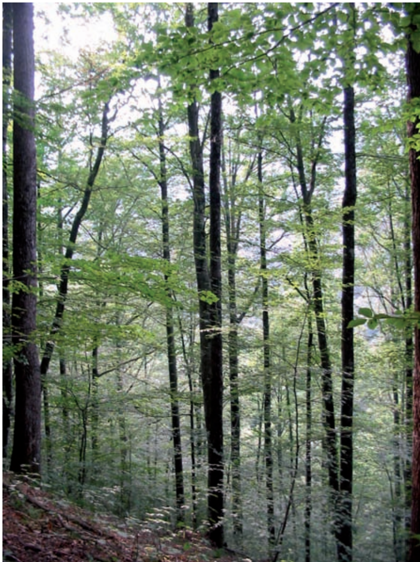
>> Roureda de roure de fulla gran de les Guilleries.

proposta molt delicada, ja que uns són venedors i altres compradors, i es poden crear posicions de força d'uns vers els altres. El millor seria promoure aliances entre rematants i propietaris per tal de poder oferir volums homogenis de fusta més grans en menys temps i, fins i tot, cercar compradors fora de les nostres fronteres, i no només per a usos energètics. A tall d'exemple, podem esmentar el cas de la serradora de Santa Coloma de Farners, que compra molta fusta a França per les raons abans esmentades.