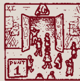
Tot obert, tothom igual, sense cap mena d'aval.