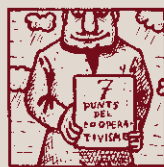
Segle i mig amb pluja i vents. Els SET PUNTS són ben vigents.