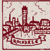
S'arribà a la gran entesa a Rochdale, vila anglesa.