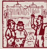
Bona tela: uns teixidors varen ser-ne els fundadors.