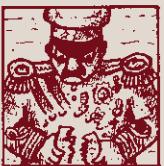
Cap a l'any quaranta-dos surt un decret ben galdós.