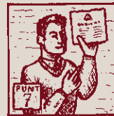
Un tret d'agermanament: promoure'n l'ensenyament.