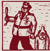
El Sindicat Vertical li donava un cop de pat.