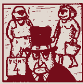
Si aquí ve el gran capital no espargue mai ni un ratl.