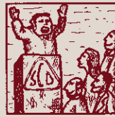
Tot ho mena una doctrina i escampar-la és feina fina.