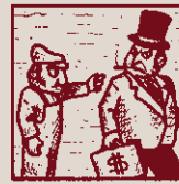
No hi ha socis de primera: o acceptar-ho, o endarrera.