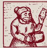
Hi ha un objectiu econòmic que no té res d'astronòmic.