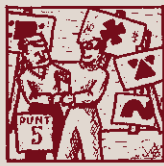
Neutralitat és la clau: Res de partits, res, si us plau.