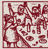
Roneix la cooperació. Endavant i autogestió!