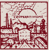
Però amb molts anys i paciència s'exemple la convivència.