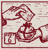
Tot pagament, al comprat. Recordem-ho: això és sagrat.