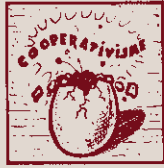
Fet històric: surt de l'ou a mitjans segle dinou.