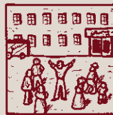
Si vols ésser-hi fidel! augmenta els socis amb zel.