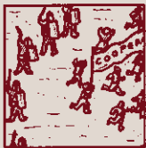
Amb la post-guerra espanyola la Cooperació grinyola.