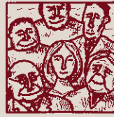
Quants més serem, més ferem fins la pesseta alçarem!!!

econòmics del funcionament de la pesca de la balena, de la qual ens dóna atenta notícia Ismael, narrador de la novel·la Moby Dick , on es detalla el repartiment dels beneficis del negoci entre els participants en funció de la seva qualificació, des de l'arponer —qui sap si caníbal— fins al capità Ahab, que no sembla especialment mogut per interessos financers.