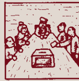
Reparar tè solució: se'n diu democratització.