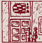
La Internacional Aliança no ens acceptava, amb rebança.