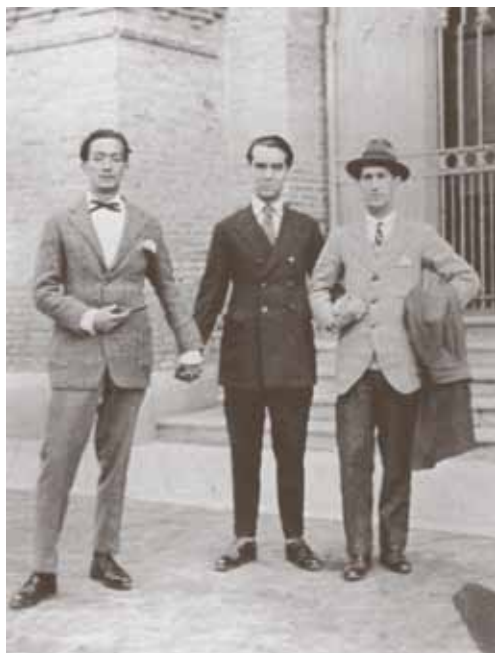
>> Salvador Dalí, Federico García Lorca i Pepín Bello. Museu de Ciències Naturals. Madrid. 1925.