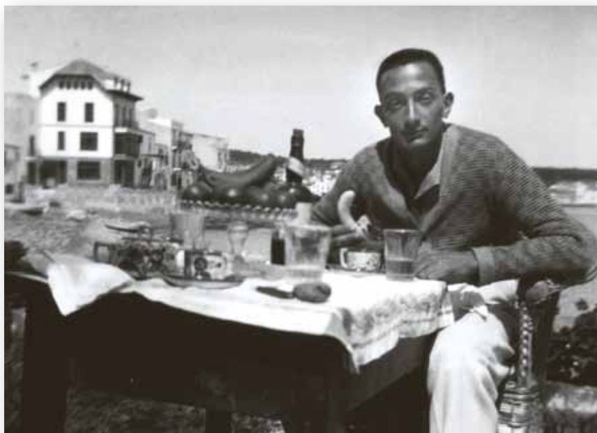
ARXIU LLUI BAS DALÍ

>> A dalt, Salvador Dalí a l'època de la redacció d' Un diari: 1919-1920 , envoltat d'amics de l'Institut. A baix, Salvador Dalí a la terrassa de la casa familiar Es Llané. Cadaqués. 1927.