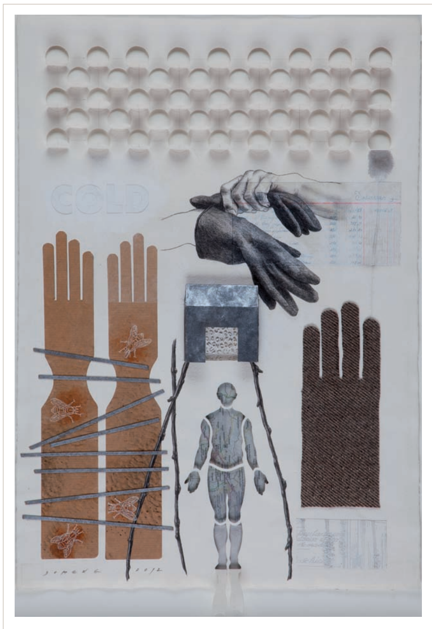
Words (2012). Dibuix i tècnica mixta sobre paper fet a mà. 70 x 5 0 cm.

les Preses (2002); el Pírcing de la terra , del parc de les Arts de Cassà de la Selva (2004); les escultures dels jardins de l'Ajuntament de Riudellots de la Selva (2006), en acer Corten i bronze, un conjunt escultòric de 25 elements de diferents mides; el conjunt de plaça Joan Tutau de Figueres (2009), en acer Corten, inoxidable i ferro de foneria, de 2,5 x 2,3 x 21 m; el monument olotí a Ernest Lluch, en acer Corten d'1,8 x 1,6 x 3,76 m, inaugurat el 2010 en commemoració del desè aniversari del seu assassinat, entre d'altres actuacions a espais interiors i particulars.