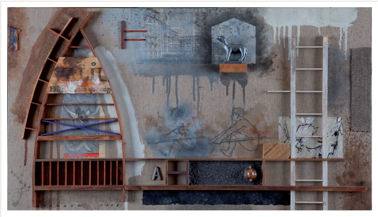
Viatges meravellosos III (2006). Tècnica mixta sobre tela . 46 x 81 cm.

primera exposició de cartells, a la Sala Vídua Armengol d'Olot, durant les fires de Sant Lluç del mateix any 1968, on les consignes polítiques tenien un gran protagonisme. Era un tast de les possibilitats plàstiques dels tres joves.