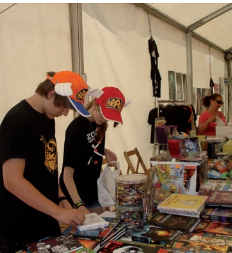
AJUNTAMENT DE TORROELLA DE MONTGRI - L'ESTARTIT