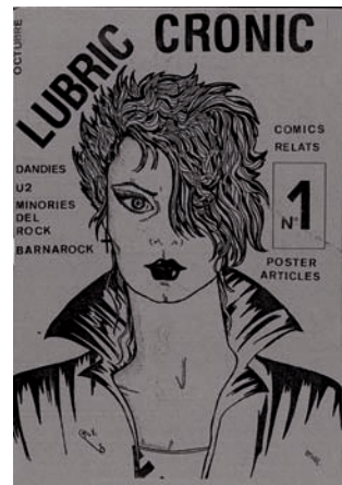
>> A l'esquerra, vinyeta d'Albert Bosch. Helter Skelter (1983). A baix, Lubric Cronic (1983).