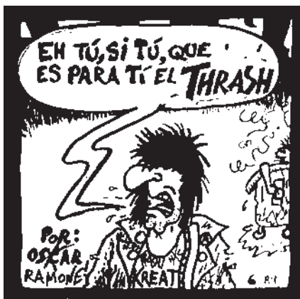
<< Vinyeta d'Oskar Ramone. Hueso Duro, núm. 8.