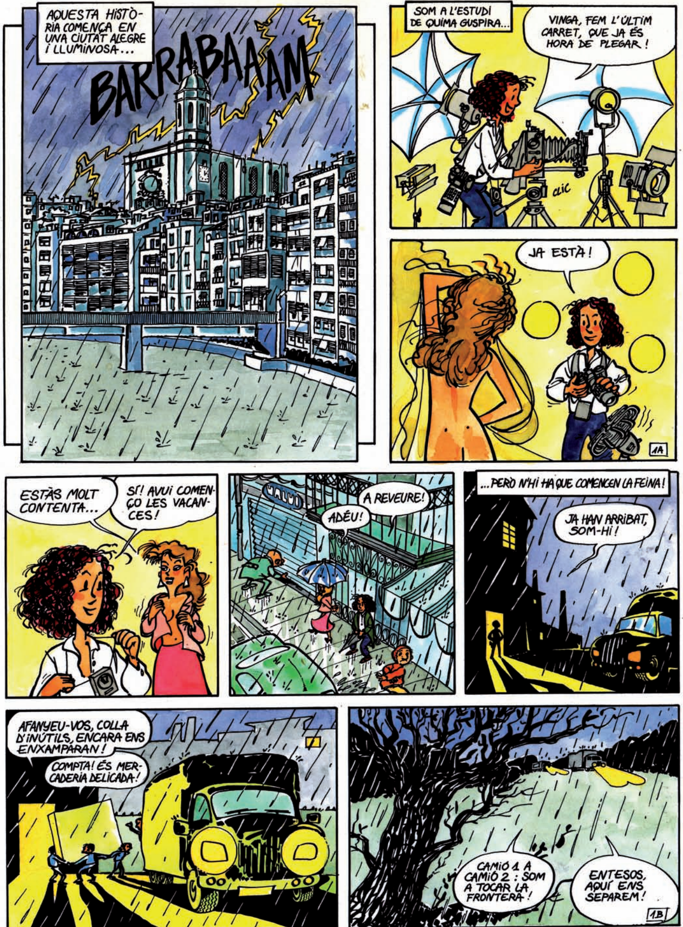
>> Primera pàgina de Quima Guspira i els falsificadors (1990). Dibuix de Joan Antoni Poch i guió d'Àngels Gardella.