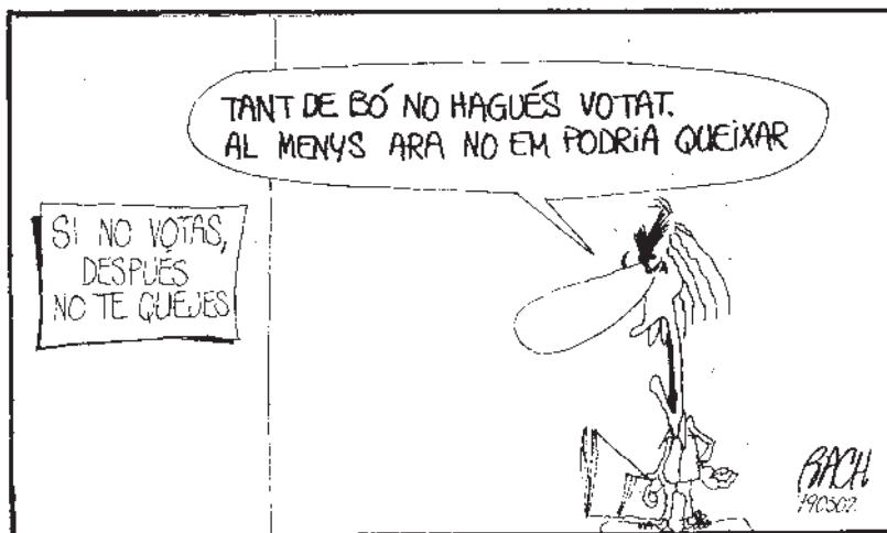
>> Jaume Bach. El Punt , 2 març 1979.

Les vinyetes de Bach, Bergé, JAP, Lluís Puigbert i de tots els ninotaires permeten, avui, veure la realitat des d'un altre enfoc i, demà, analitzar el passat