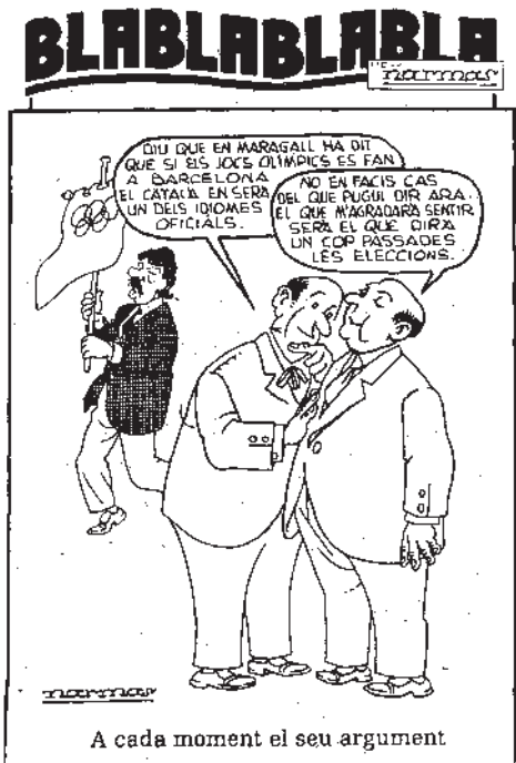
A cada moment el seu argument