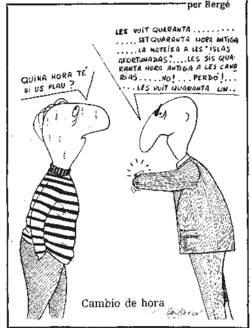
Cambio de hora

Figueres. El 1981 es va autoeditar el llibre Tres-cents acudits .