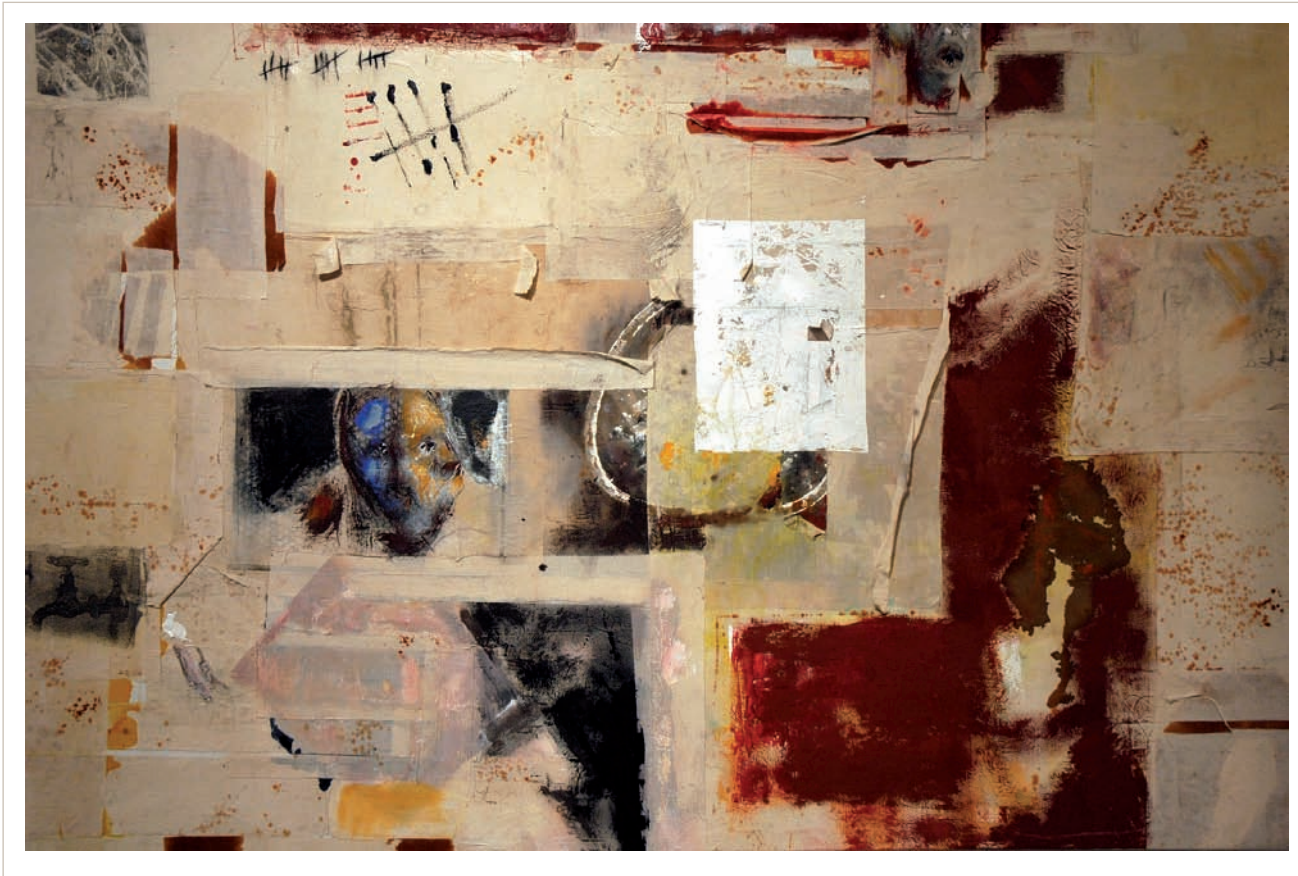
Sense títol. 2011. Pintura sobre tela. 195 x 130 cm.

rents. El també artista Jordi Mitjà, bon coneixedor de tots dos, va escriure d'ells amb motiu de l'exposició abans esmentada: «El pura sang d'en Joan s'esmuny des de fa anys per no enfrontar-se a la disciplina, a l'obra, enfrontant-s'hi segon rere segon des del no fer. En Miquel, per contra, és absolutament disciplinat, pinta diàriament i construeix una obra que creix i es fa sàvia. L'un pensa la pintura fugint-ne i l'altre la pensa aplicant-s'hi intensament i obsessivament. (...) Són com la nit i el dia en l'instant que es toquen. Tots dos, però, estimen l'ofici de pintar, i són gats vells. De tant en tant s'esbatussen per retrobar-se i reconciliar-se (...). La mateixa estratègia la podem aplicar en cada centímetre quadrat d'aquests nou o deu quadres pintats a quatre mans a l'Astoria».