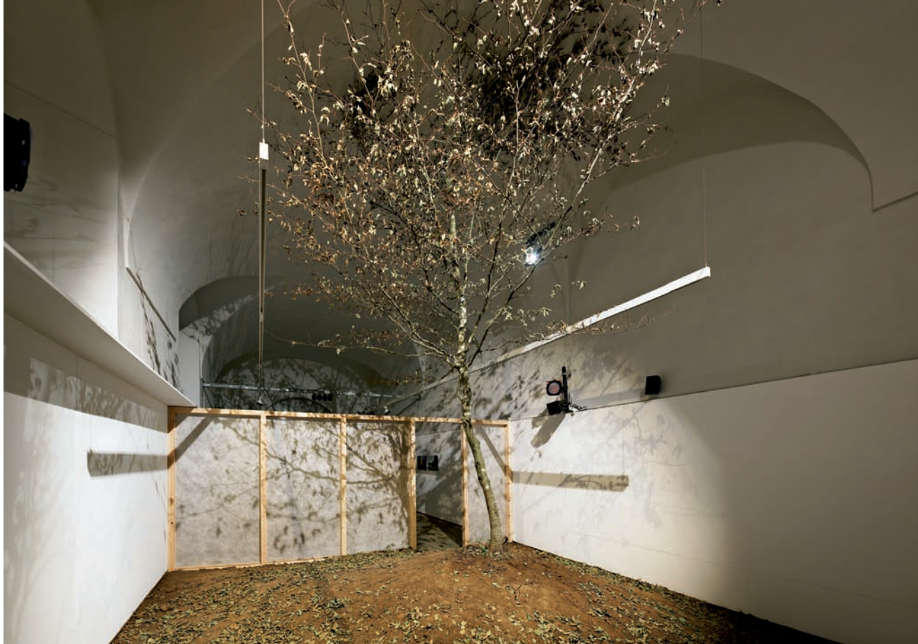
>> Instal·lació de Job Ramos.

ciplinarietat és bandera en els espectacles literaris d' A pas de poetes que organitza La Mercè, barrejant-hi arts plàstiques i dramàtiques, dansa i música.