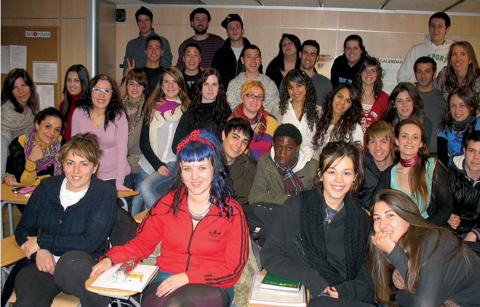
>> Estudiants del Grau Superior de l'Escola d'Adults de Girona.

Per celebrar el seu trenta-cinquè aniversari, les diferents comissions han programat trenta-cinc actes que inclouen tallers, xerrades, cinefòrums, sortides, activitats esportives... La revista d'aquest curs inclourà un monogràfic amb col·laboracions de gent que, d'una manera o altra, ha ajudat a fer créixer el centre. També s'elaborarà un DVD informatiu. La traca final serà una festa al carrer.