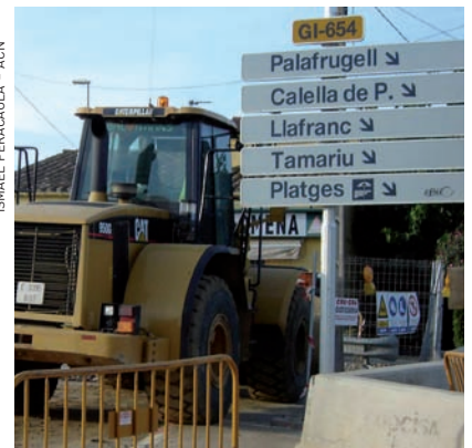
ISMAEL PERACALLA - ACN

>> Obres a l'anella de les Gavarres a Mont-ras.