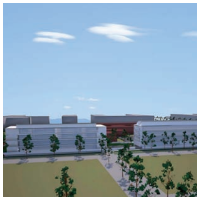
ACN - AJUNTAMENT DE FIGUERES

>> Maqueta de l'escola-residència de dansa Àngel Corella.