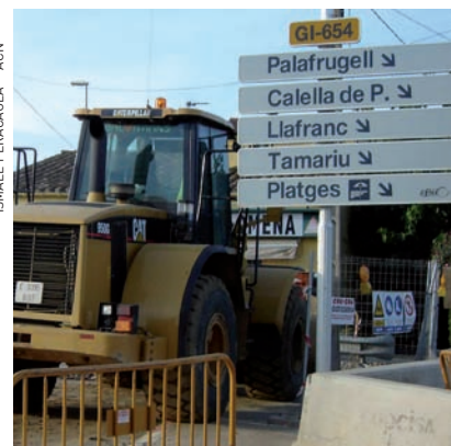
ISMAEL PERACALLA - ACN

>> Obres a l'anella de les Gavarres a Mont-ras.