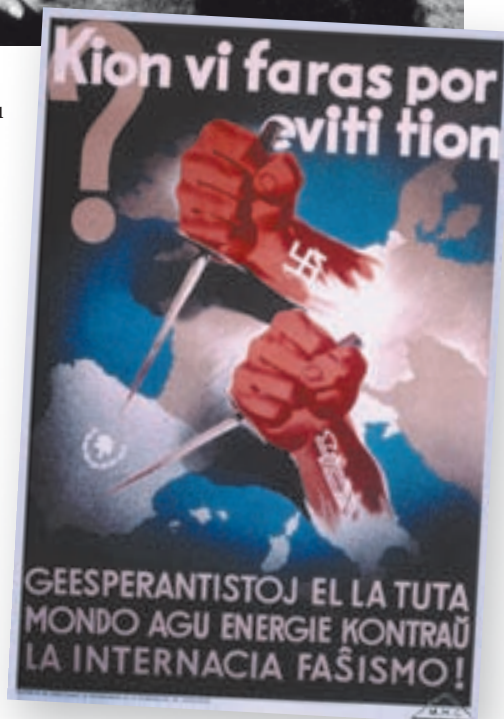
>> Un dels cartells editats pel Comissariat de Propaganda, en una de les llengües d'ús que li eren habituals, l'esperanto.

El setè capítol, Homes del món , podria haver constituït per si mateix un