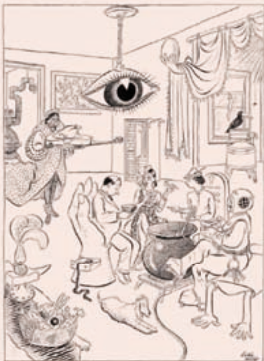
A SURREALIST FAMILY HAS THE NEIGHBORS IN TO TEA

Trotsky, Eugene O'Neill, John Dos Passos i William Randolph Hearst. The New York Times va destacar la caricatura de Dalí com una de les «més devastadores» del conjunt (25 de febrer de 1937).