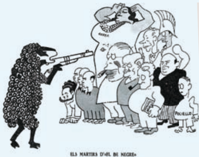
ELS MARTIRS D'EL BE NEGRE

Els ninotaires americans solien parodiar Dalí amb elegància, ironia i subtillesa; una actitud que, en el fons, deixava traslluir la seva admiració cap a tot allò que representava el surrealisme.