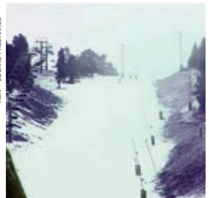
>> La pista de Coma Oriola, a Masella.