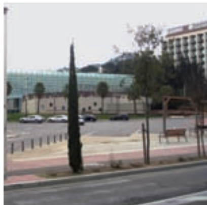
>> Teatre de Lloret de Mar.