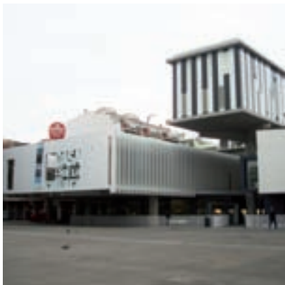
>> Biblioteca de Lloret de Mar.

Tots aquells que es dediquen al turisme saben prou bé que el factor meteorològic és essencial per a l'èxit de la temporada. A Cerdanya, moltíssima gent viu, a l'hivern, del món de la neu, si no directament treballant a les pistes, de manera secundària a l'hostaleria o al comerç. En un any com aquest en què l'escenari econòmic és tan delicat, una bona temporada d'esquí hagués amorosit la situació. Pel carer, el comentari entre coneguts que se saluden glosa indefectiblement la manca de neu. Els més grans recorden que abans —quan tots els abans eren millors— feia tals nevades que els carrers quedaven impracticables durant tot l'hivern. Més enllà de la memòria caldrà revisar les dades, caldrà veure la tendència real d'aquestes precipitacions gelades que donen vida a la comarca, caldrà valorar si l'escalfament global ens està fent la guitza i si el que es pot esperar és que cada vegada nevi menys. Tot plegat és essencial per enfocar correctament el futur i adaptar-se als nous temps, també meteorològics. De moment, per al 2022 el país es postula per fer d'amfitrió d'uns Jocs Olímpics d'hivern. Si l'hivern del 2022 és com el d'enguany, ai.