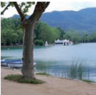
>> L'estany de Banyoles.

Demografia | Segons les darreres dades facilitades per l'Institut Nacional de Estadística de l'Estat —cal constatar que les donen amb un any de retard— a la comarca de la Selva hi ha hagut un augment de població de 1.258 habitants (és a dir, el dia 1 de gener de 2010 hi havia 169.524 habitants, i el primer de gener de 2011 eren 170.782) i l'augment ha estat general excepte en les poblacions d'Amer (té un descens de 29 persones), de Blanes (ha perdut 176 habitants), de Massanes (perd 26 habitants), Sant Feliu de Buixalleu (en perd