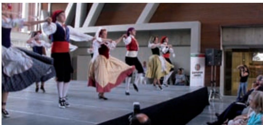
>> Actuació de l'Esbart Fontcoberta.