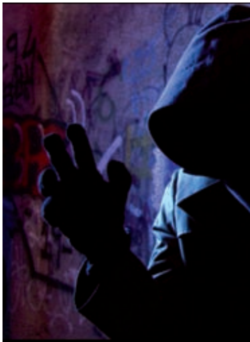
>> Fotograma d'El oculto.