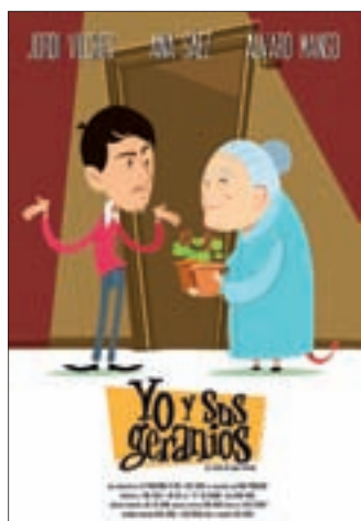
>> Cartell de Yo y sus geranios.