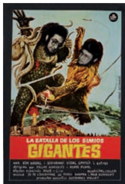
>> La batalla de los simios gigantes (1983) i a l'esquerra, Eleccions a Girona, s.d. [1983].