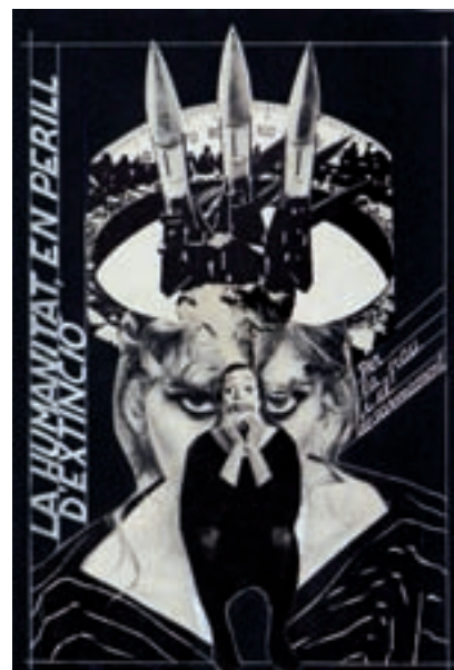
>> Portada del llibret La humanitat, en perill d'extinció (1983), editat pel Col·lectiu Ecologista de Girona.

La poètica visual del grup s'assentava en un ric desplegament de figures retòriques sovint posades al servei d'un objectiu desmitificador