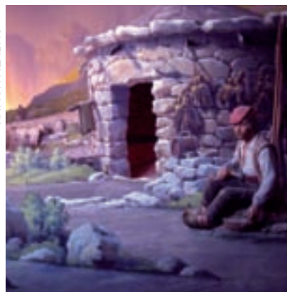
>> Diorama del Museu Etnogràfic de Ripoll.