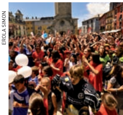
>> Lipdub cerdà.

Si us agrada guaitar feu un tomb pel museu. Hi trobareu objectes tan valuosos com una pistola de roda dels segles XVI-XVII, i tan sorprenents com un rellotge de sol de pastor o un altar de joguina per jugar a dir missa. Des- cobrireu una completa col·lecció d'ex- vots, retaulons de fusta pintada, que evoquen indumentària, creences i cos- tums perillosos. Quedareu bocabadats davant el diorama dels pastors o el dels clavetaires, i sempre hi haurà algun objecte en un racó que us farà l'ullet únicament i exclusiva per a vosaltres.