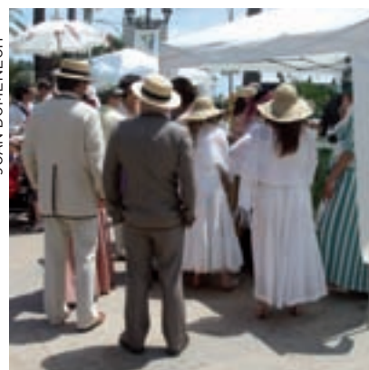
>> Americanos ressuscitats per la màquina del temps.