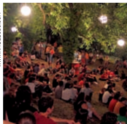
>> Nit de Bosc.