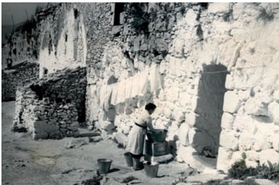
>> Una dona renta la roba i l'estén.