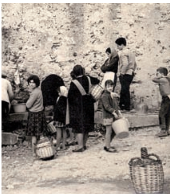
dipòsits d'aigua a la torre de defensa de Sant Joan.