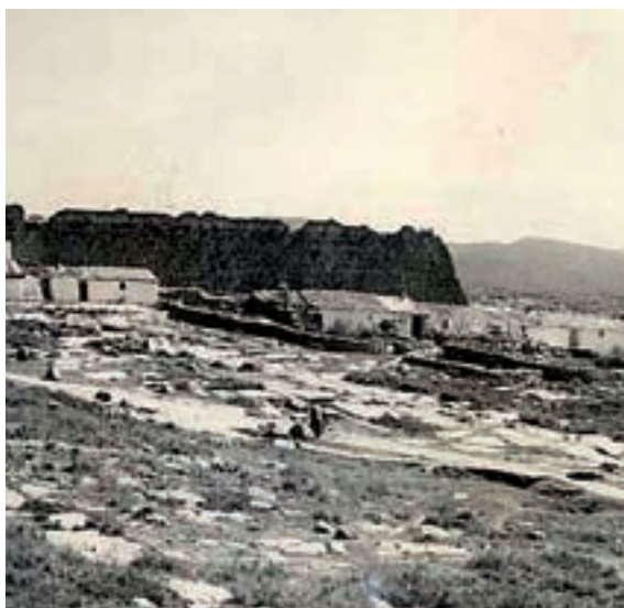
i el castell van formar un mateix paisatge.