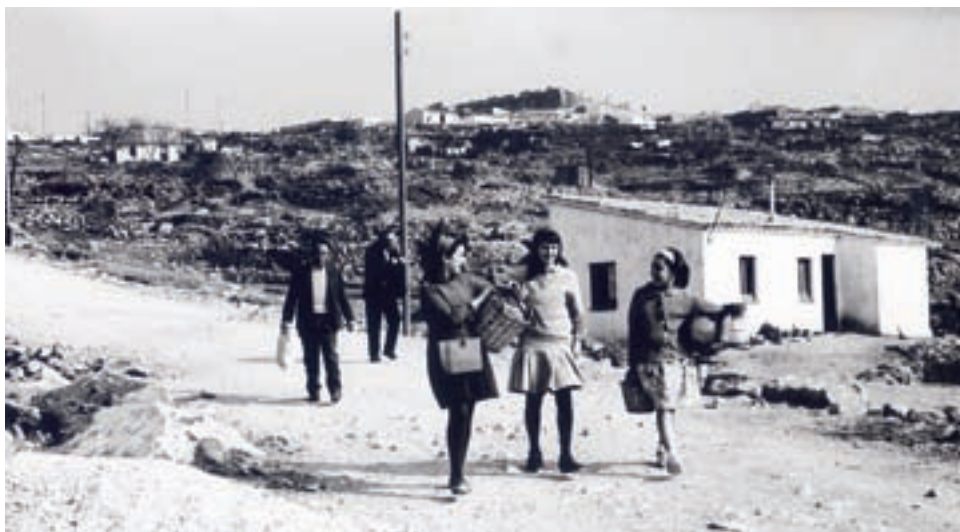
>> Tres nenes baixen a buscar aigua amb garrafes al braç.

ASSOCIACIÓ D'AMICS DEL CASTELL DE MONTJUÏC