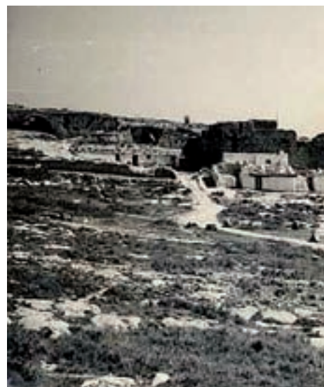
>> Durant molt de temps les barraques