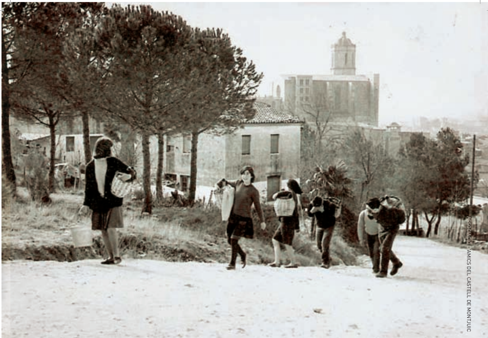
ASSOCIACIÓ D'AMIGOS DEL CASTELL DE MONTJUÏC

que en deien servientas o empleadas del hogar ; jornalers; pintors; paletes; algun mecànic, rarament; algun xofer, aïllat; algun ferroviari... fins i tot algun perruquer. I també en vaig veure algun que tenia com a professió tècnica de ràdio. Però el més habitual era gent sense qualificació professional».