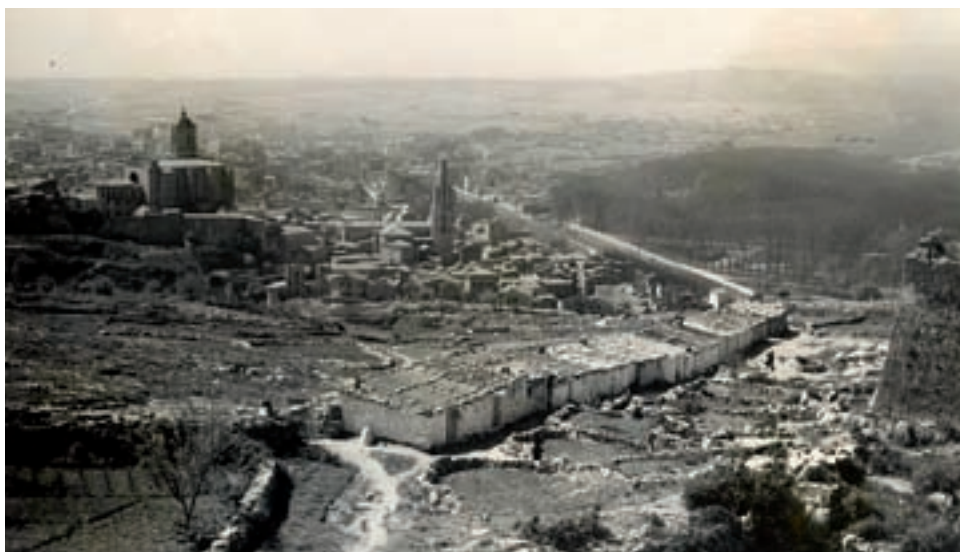
>> Les barraques van constituir un poblet amb la Girona antiga de fons.