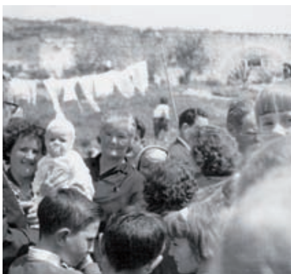
a Montjuïc, l'abril de 1968.