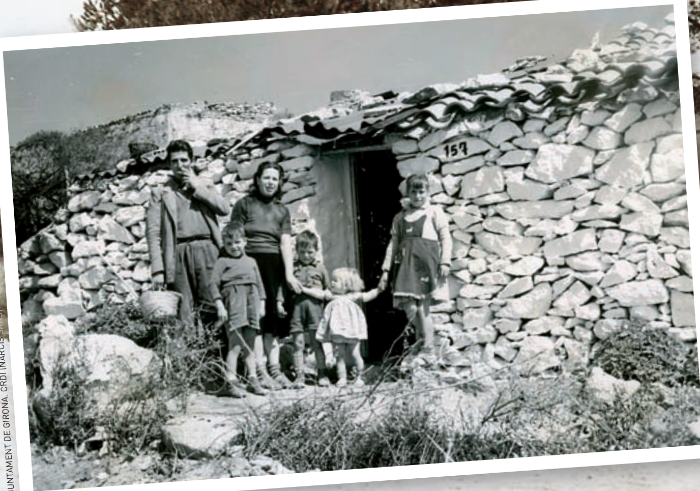
>> Imatge d'una família a la porta de la seva barraca.