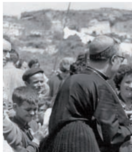
>> El bisbe Narcís Jubany, en una visita a

ASSOCIACIÓ D'AMICS DEL CASTELL DE MONTJUÏC