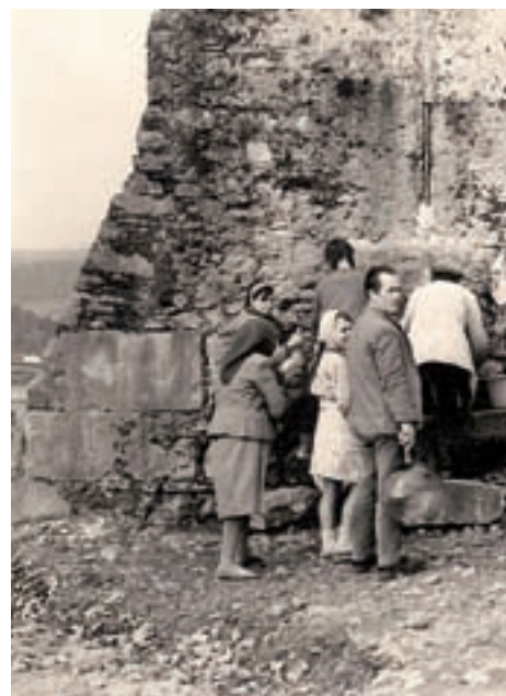
>> L'any 1963, l'Ajuntament va instal·lar d

ASSOCIACIÓ D'AMICS DEL CASTELL DE MONTJUÏC