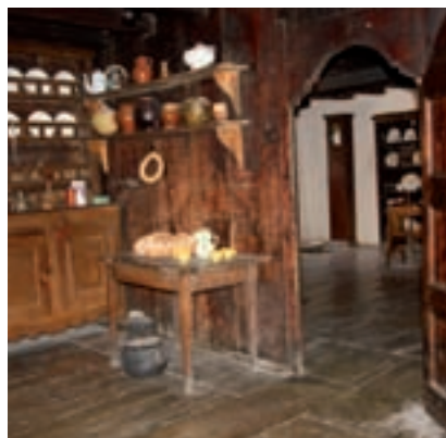
ACN - MARTA LLUVICH

>> L'Ecomuseu de les Valls d'Àneu, precursor de l'Ecomuseu del Camp.