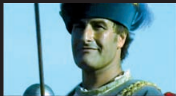
>> Ajuntament de Pals.