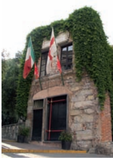
>> Casa on (suposadament) va néixer el Cristoforo Colombo genovès.