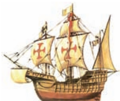
>> La Santa Maria, la nau capitana.

La realitat, però, és que amb el «descobriments» d'Amèrica la Corona d'Aragó entrà