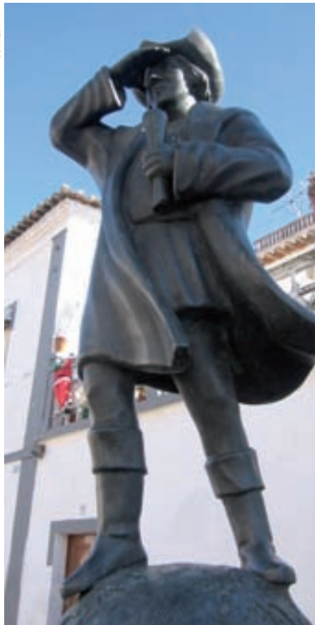
>> Estàtua de Cristòfor Colom a Cuba (Portugal).

país, especialment per les mines de Potosí. Quan hi va arribar, l'any del quart centenari del descobriment (també l'any en el qual la ciutat de Barcelona va fer aixecar el monument a Colom, on apareixen les escultures de quatre catalans –dos d'ells gironins– que acompanyaren l'almirall en el seu segon viatge a Amèrica), la tesi gallega començava a fer forat. Ulloa, d'origen galleg, s'hi va interessar, però ben aviat es va adonar que aquelles teories no tenien arguments i que, per contra, la catalanitat de Colom en guanyava a mesura que l'estudiava.