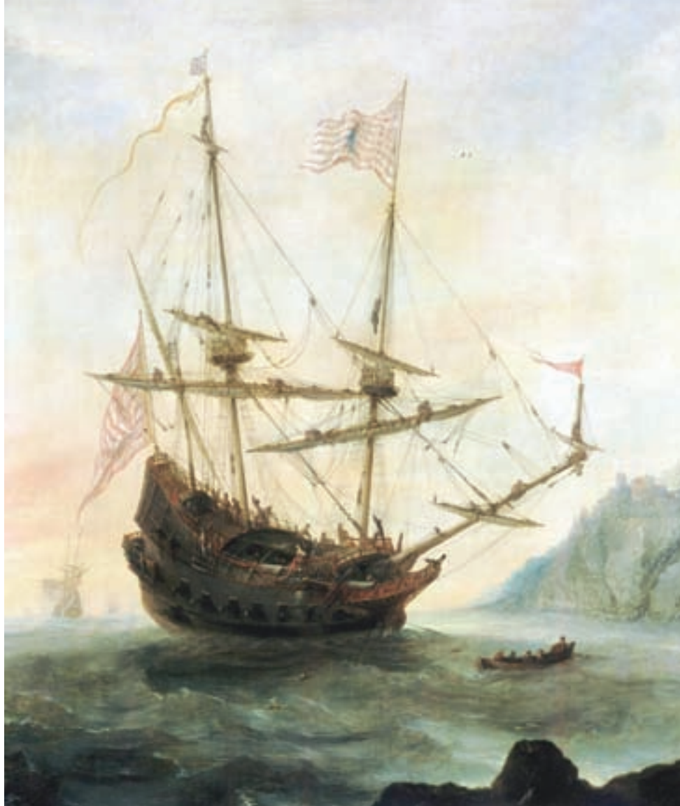
>> El Santa Maria, d'Andries van Eertvelt, pintat el 1628.

En un panorama polític enrevessat, just quan a Europa es començaven a forjar els grans estats, i els enverinaments, les traïcions i les conxorxes eren a l'ordre del dia, no ens ha d'estranyar que hi hagi qui dubta de tot. Qualsevol document queda sota sospita i molts han estat definitivament desprestigiats després de descobrir-ne falsificacions matusseres. Mentre que la universitat no