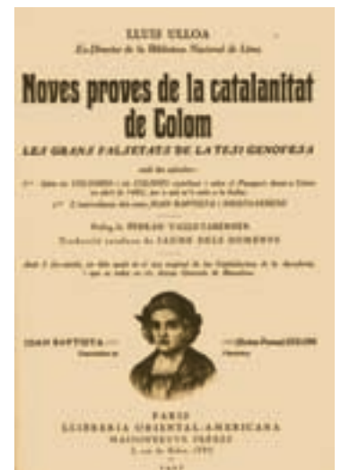
>> Portada del llibre del peruà Luis Ulloa de 1927.

La possibilitat que Colom fos català, afortunadament, no va ser apuntada per primer cop per un compatriota nostre, sinó per l'estudiós peruà Luis Ulloa y Cisneros