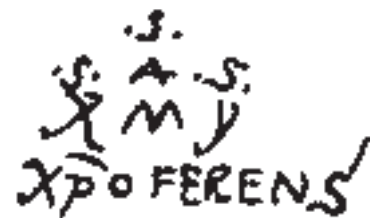
>> Signatura de Colom.

1497 de la seva Carta des de les Índies hi diu: «traduïda del llatí i el català a l'alemany». Malgrat tot, en analitzar els textos que es conserven, molts estudiosos hi han descobert el rastre d'una llengua materna que seria la catalana. Pere Català i Roca ha trobat en escrits de l'almirall expressions com ara a todos arreo (per 'a tot arreu') o todo de un golpe (per 'tot d'un cop'), i Jordi Gálvez considera Colom «el veritable pioner en la introducció de paraules catalanes en el castellà», entre les quals els diminutius acabats en eta .