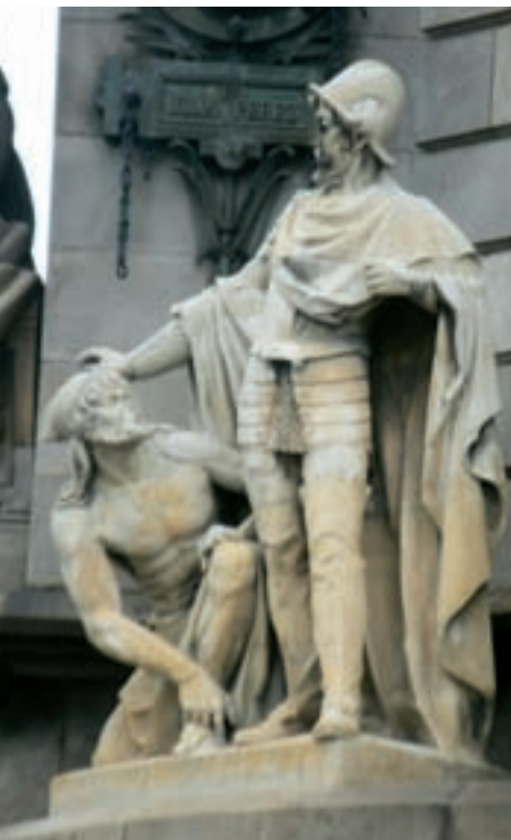
>> Escultura a la base del monument a Colom que representa Pere de Margarit, capità de vaixell.

sos conservats no van permetre d'extreure les dades completes de l'ADN. I el professor Lorente arribà a la conclusió que tant els Colom catalans (van participar de les proves unes 240 persones) com els Colombo italians (amb les mostres d'una mica més de cent persones) tenien l'ADN tan semblant que no es podia destriar.