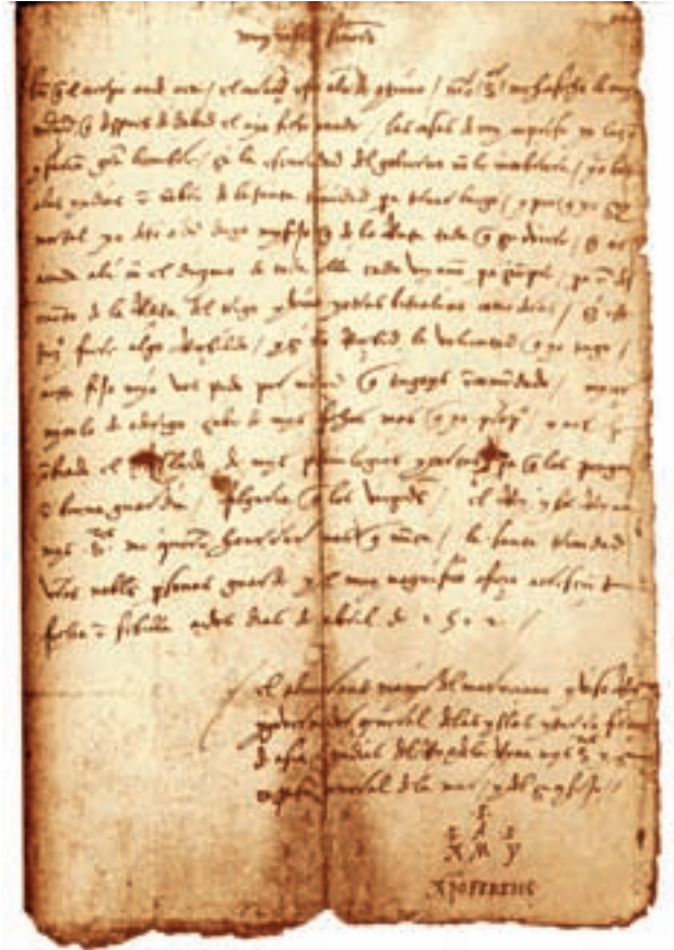
>> Carta de Colom de 2 d'abril de 1502, on diu: «Aunque mi cuerpo esté aquí, mi corazón está allí de continuo». Fins fa pocs anys, alguns historiadors afirmaven que hi deia: «Aunque mi cuerpo esté aquí, mi corazón está en Génova».