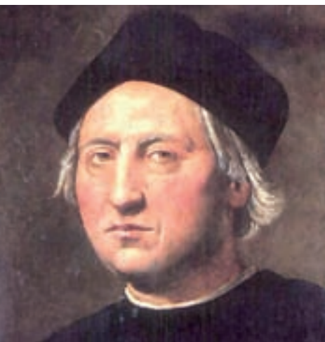
>> Cristòfor Colom (lloc desconegut, 1436/1451-Valladolid, 1506).