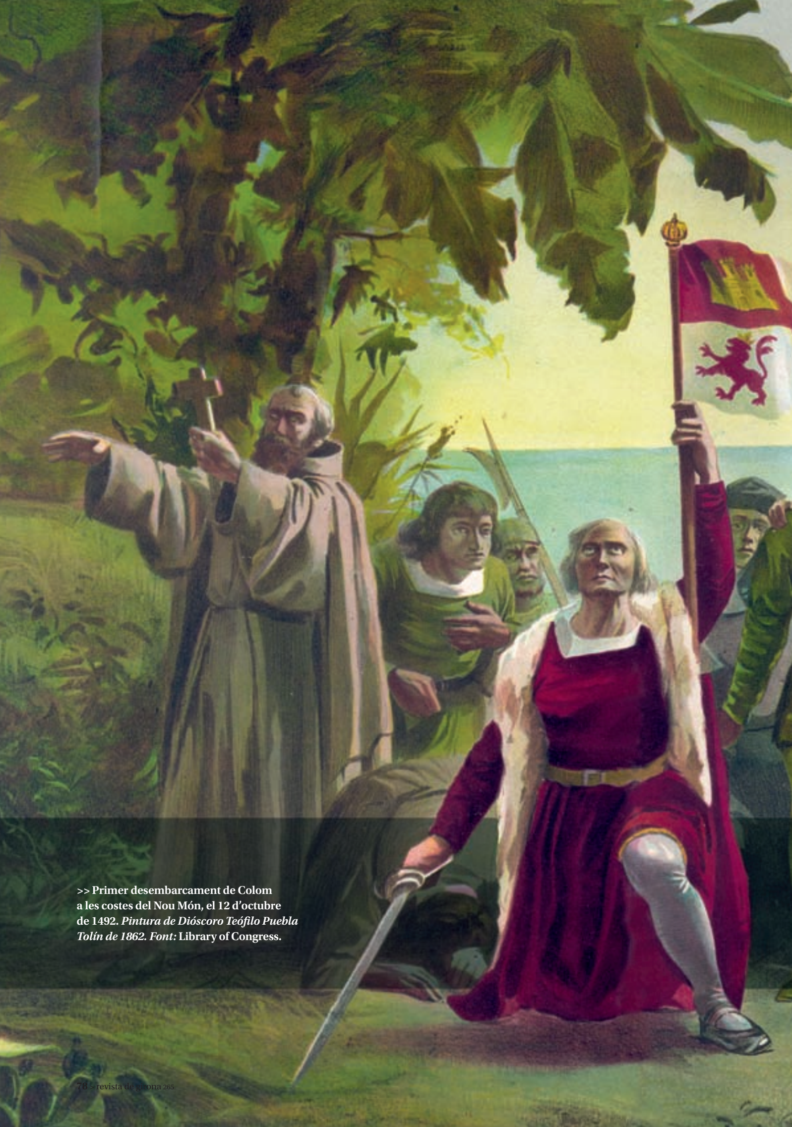
>> Primer desembarcament de Colom a les costes del Nou Món, el 12 d'octubre de 1492. Pintura de Dióscoro Teófilo Puebla Tolín de 1862.