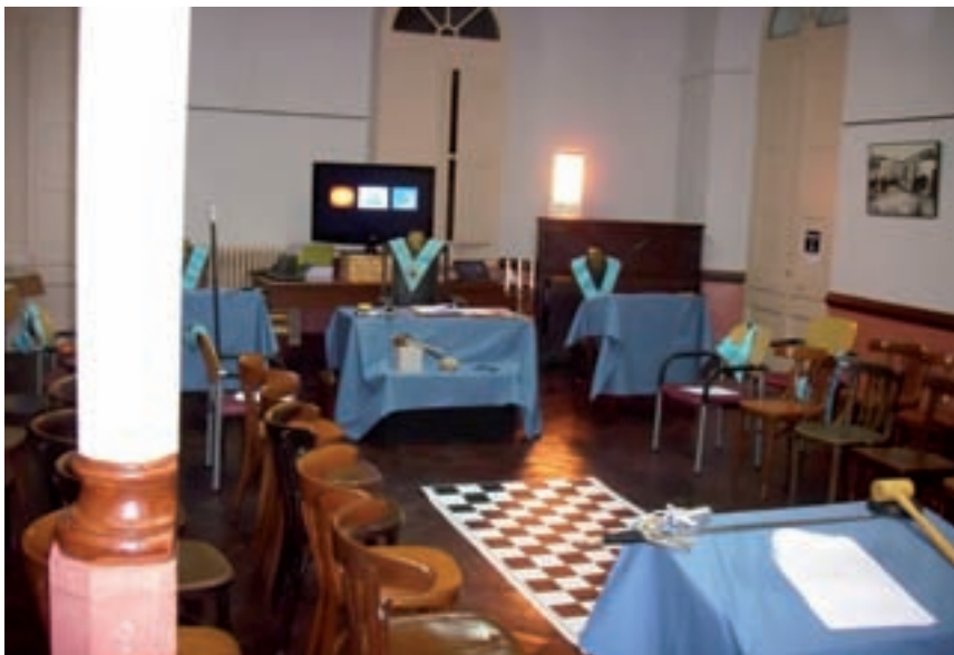
>> Interior del temple de la lògia Pedra Tallada, de Palafrugell, taller que manté les seves reunions en una sala cedida per l'emblemàtic Centre Fraternal de la població.