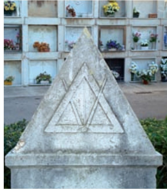
>> Detall d'una de les tombes maçoniques de l'antic cementiri civil de Figueres.

tits pobles com Cabanes, Garriguella i Pau, i també a Llançà. Al Baix Empordà hi va haver tallers a Calonge, Palafrugell (la ja esmentada Luz, fundada el 1888), Sant Feliu de Guíxols i Palamós. Tant a la Cerdanya com a la Garrotxa hi va funcionar una única lògia, ambdues en actiu des del 1881. Al Gironès es van instal·lar tallers a Girona, Cassà de la Selva i Llagostera. Al Pla de l'Estany hi van funcionar tres lògies, totes tres a Banyoles. I a la Selva es van establir lògies a Blanes, Breda, Sant Hilari Sacalm, Santa Coloma de Farners, Tossa de Mar –on entre 1894 i 1897 va estar en actiu un grup maçonnic anomenat El Esfuerzo, sorgit a l'empara de la lògia madrilenya El Progreso– i Vidreres.