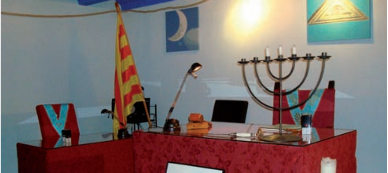
>> Detall de la lògia Llum, de Figueres, en què es pot veure la taula del venerable mestre, l'encarregat de dirigir el taller.

la Gran Lògia Simbòlica Espanyola (GLSE-GOEU), fundada el 1980 i amb seu a Barcelona, que permet als seus tallers escollir si volen ser d'exclusivitat masculina, femenina o mixtos. La lògia Pedra Tallada, que ha optat pel model mixt, es va crear l'octubre del 2009, però la seva inauguració oficial –d'encesa de llums i aixecament de columnes– no va tenir lloc fins al 17 de juliol de l'estiu passat. L'acte, en el qual van participar més d'un centenar de maçons, es va celebrar a l'Hotel Garbí, a Calella de Palafrugell, i va estar presidit pel gran mestre de la GLSE-GOEU, Jordi Farrerons, i pel de la Gran Lògia de Catalunya i Balears, Vicenç Abellán, entre altres.