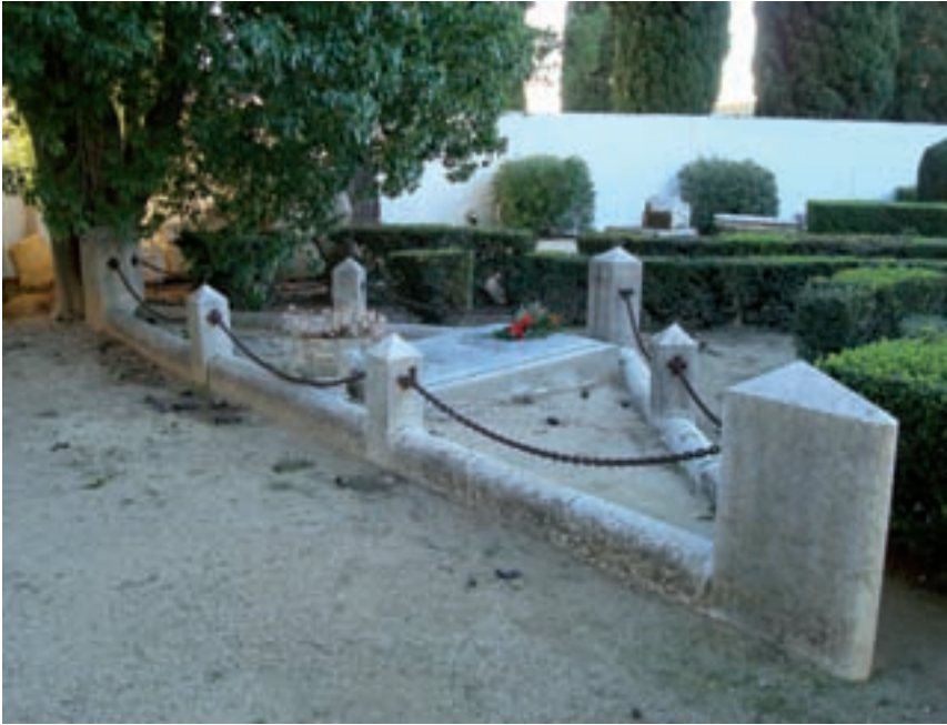
>> Un dels senzills panteons maçonics –de final del segle XIX– en forma de triangle de l'antic cementiri civil de Figueres, integrat actualment al cementiri municipal.