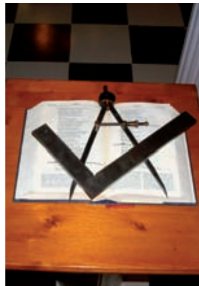
>> La Bíblia amb l'escaire i el compàs, a la lògia Llum de Figueres.

Considerada per alguns com una secta, per altres com una societat secreta i coneguda a fons per ben pocs, la veritat és que sobre la maçoneria corren mil i una idees rocambolesques i poques certes. I, tot sigui dit, que es tracti d'una societat no secreta però sí molt discreta no l'ajuda gaire a treure's de sobre algunes de les disfresses inadequades amb què des de la ignorància o la mala intenció se l'ha anat bastint.