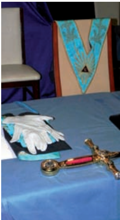
>> Taula del venerable mestre de la lògia Pedra Tallada, de Palafrugell, en què es pot veure l'espasa flamígera, el mandil, el collar del càrrec i els guants del ritu francès, disciplina seguida per aquest taller.

nar a funcionar ininterrompudament del 1926 al 1936. A Girona, en canvi, la maçoneria no va reprendre la seva activitat fins al 1931, amb la fundació del triangle Álvarez de Castro, que es convertí en lògia, en augmentar-ne el nombre d'inscrits, l'any 1934, i que va estar en actiu –com la lògia figuerenca i tantes altres– fins a l'esclat de la Guerra Civil, l'any 1936.