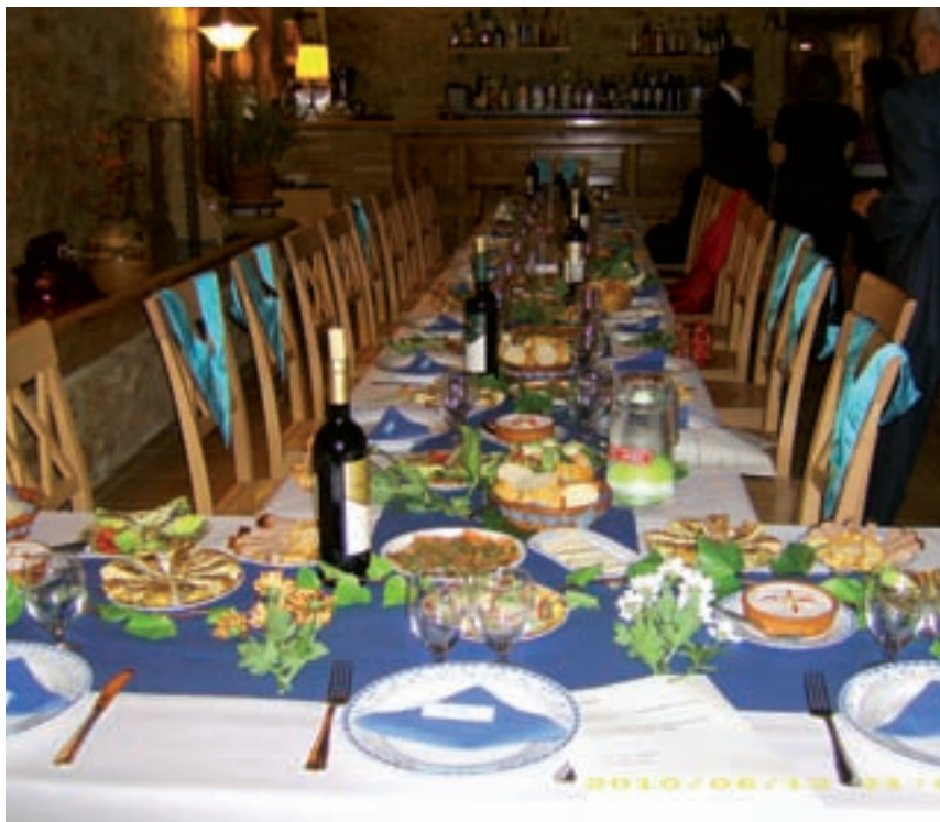
>> Taula parada per a un dels banquets solsticials que celebra la lògia Pedra Tallada, adscrita a la GLSE-GOEU i inaugurada l'any passat.

A partir del 1939, amb la victòria del bàndol franquista, la maçoneria va començar a ser perseguida de forma ferotge i quasi malaltissa, amb especial contundència –com ja hem dit– a partir de l'aprovació de la llei de l'1 de març de 1940, mitjançant la qual s'assimilava la maçoneria al comunisme. Per tal d'aplicar aquesta nova llei, el règim va crear fins i tot un nou òrgan: el Tribunal Especial de Repressió de la Maçoneria i el Comunisme, que es va mantenir en actiu fins al 1963, en què va ser substituït pel Tribunal d'Ordre Públic.