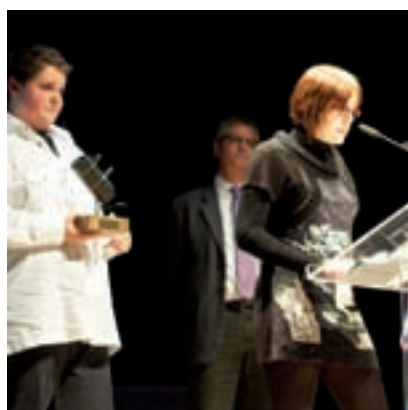
>> Ripollès Líders.