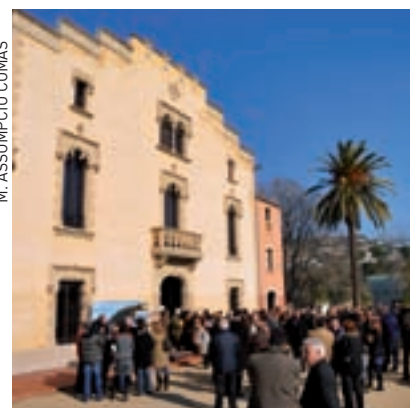
>> Can Saragossa, nou equipament.