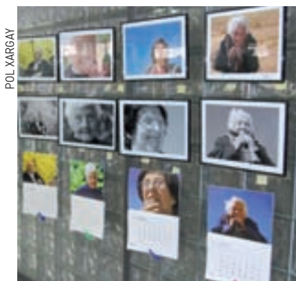
>> Calendaris de dones grans.