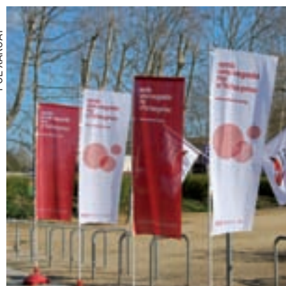
>> Donació de sang a Banyoles.