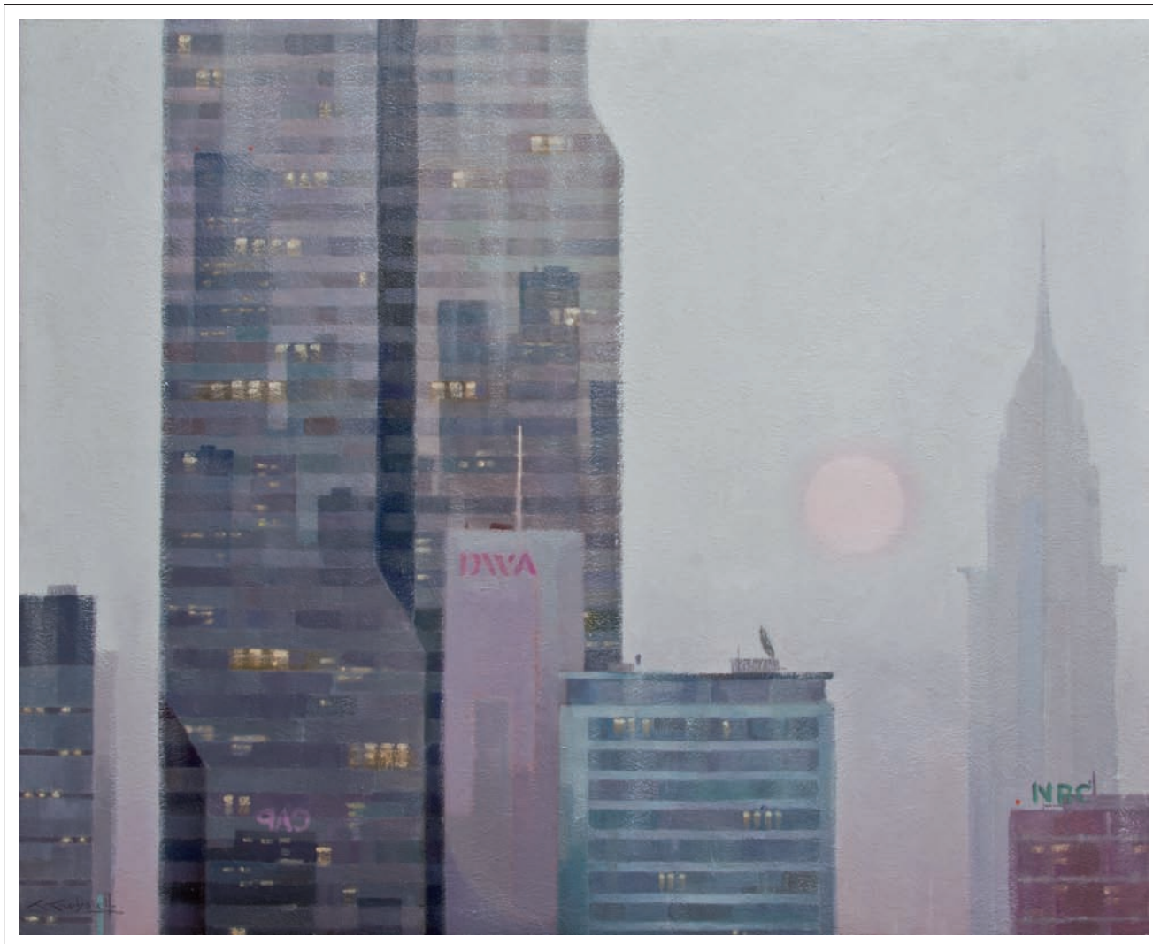
Set pm. 2009. Oli sobre tela. 100 x 81 cm.

on pot fer una composició molt més racional i equilibrada. Considera que aquí és on crea, traient el que li sobra de l'observació que havia fet, i afegint-hi el que li falta. El natural és només una referència llunyana, el punt de partida. Per aquest motiu ha emprat poques vegades la fotografia, ja que, opina, el condiciona massa. Li agrada equilibrar els espais, els volums, els colors, una racionalitat que al natural costa que es doni.