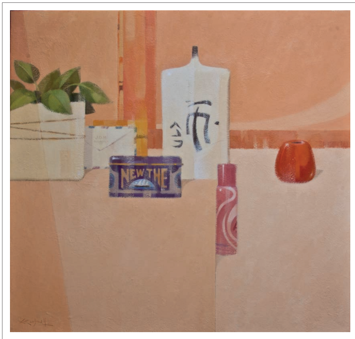
New The. 2007. Oli sobre tela. 100 x 95 cm.

També ha pintat moltes vegades bodegons o composicions d'objectes, en paraules seves, igualment equilibrats en la composició, on les superfícies buides són tan importants com els elements representats.