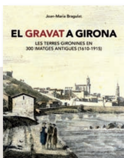
JOAN-MARIA BRAGULAT El gravat a Girona

Un llibre de 740 pàgines amb lletra tirant a petita, ple de gràfiques cartesianes i amb derivades parcials fa basarda al més atrevit. Si, amb la precaució que el monstre requereix, fem una agosarada incursió a l'índex, hi veurem apartats tan freakies , sospitosos o esotèrics com «Competència entre oligopolistes: el càrtel», «El model de Stackelberg o l'avantatge de moure primer» o «Els desplaçaments de les corbes». No parlem ni d'un manual per infiltrar-se a les màfies colombianes, ni d'un tractat d'obertures d'escacs, ni de res afí a les voluptuositats dinàmiques d'algú de bon veure. Es tracta d'un manual de microeconomia per a estudiants universitaris, elaborat –com diu el mateix autor, catedràtic de teoria econòmica de la UAB– «a partir de tres enfocaments: el literari, el gràfic i el matemàtic». Cal dir, però, que hi dominen els dos primers.