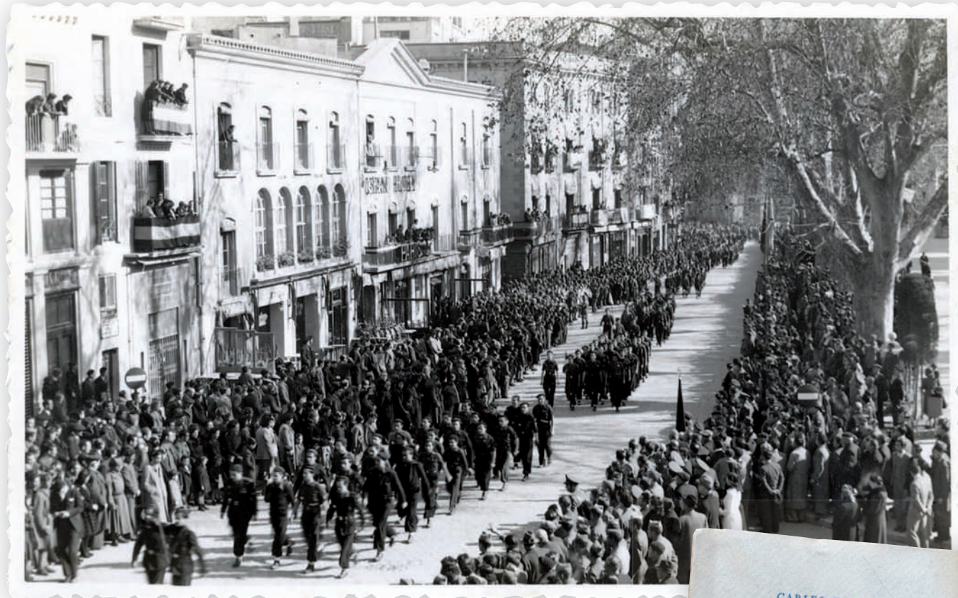
>> Desfilada militar a la Rambla figuerenca un cop acabada la guerra.